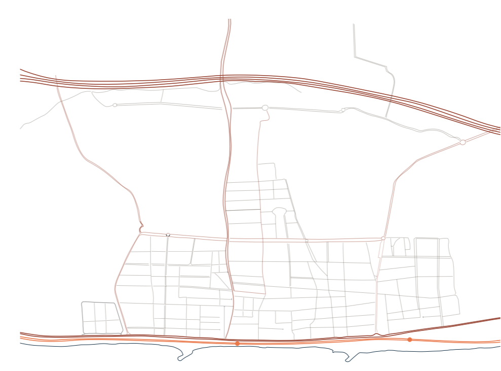
2. Sovraccarico stradale