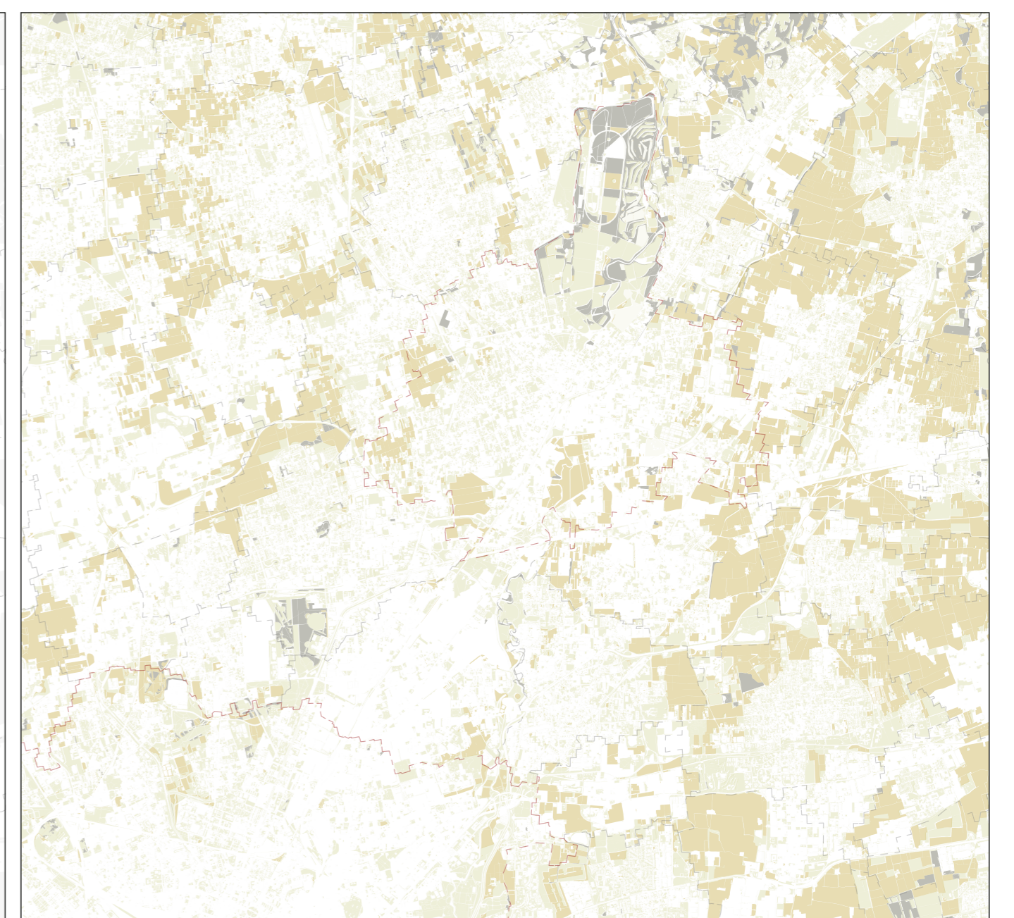
Sistema degli spazi aperti 1:100.000