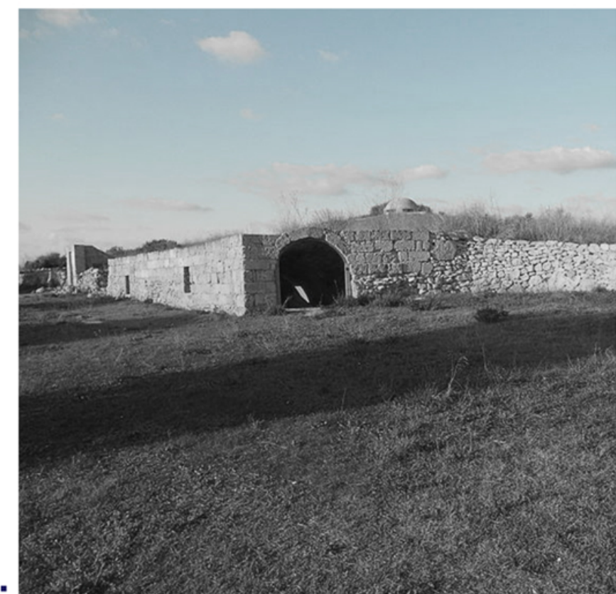
Epoca romana_ Cisterna