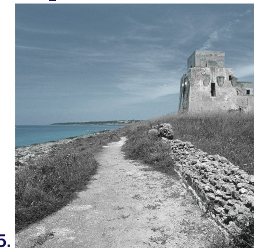
1500_ Torre anticorsara