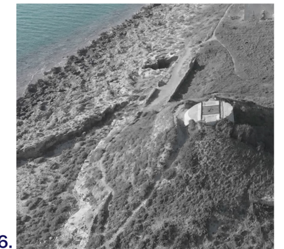
Il Guerra Mondiale_ Bunker