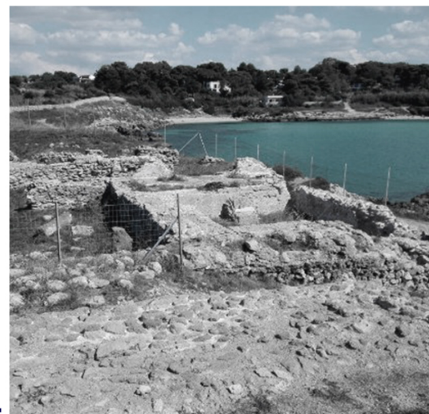
Età imperiale_ Pars Urbana