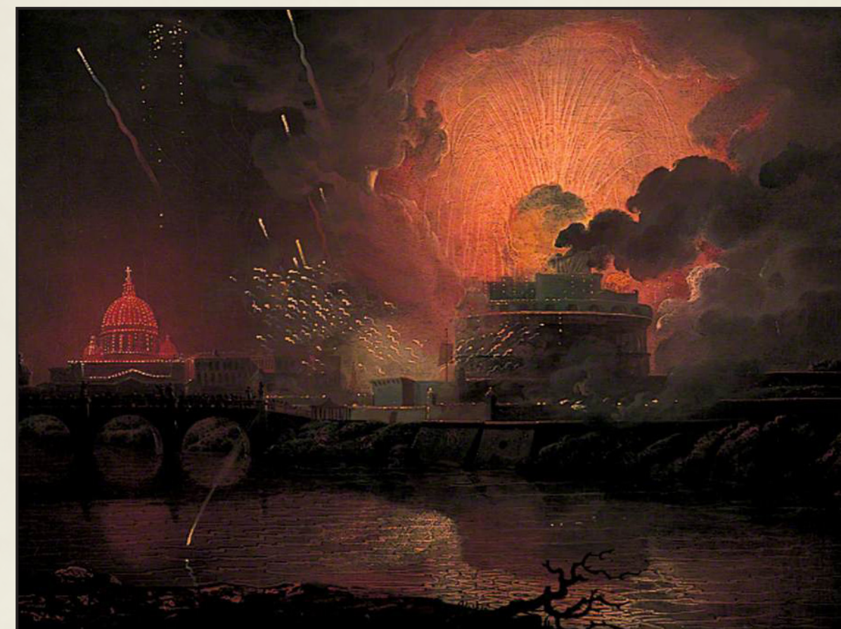
Joseph Wright of Derby - Spettacolo Pirotecnico a Castel Sant'Angelo, 1770