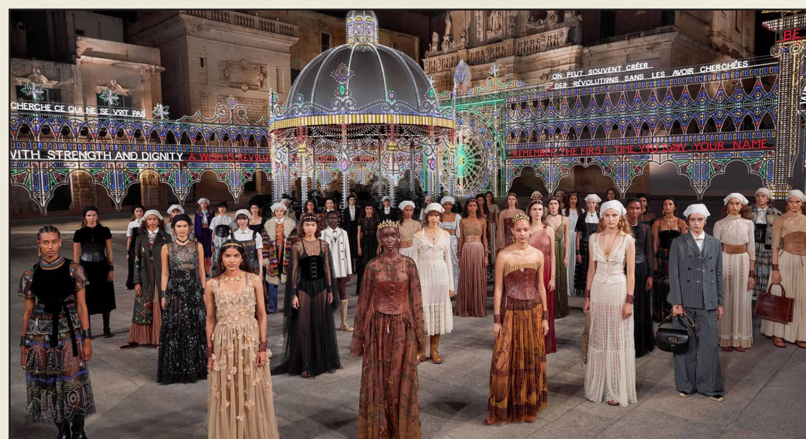
Fashion show di Dior nella Piazza del Duomo di Lecco, 2021