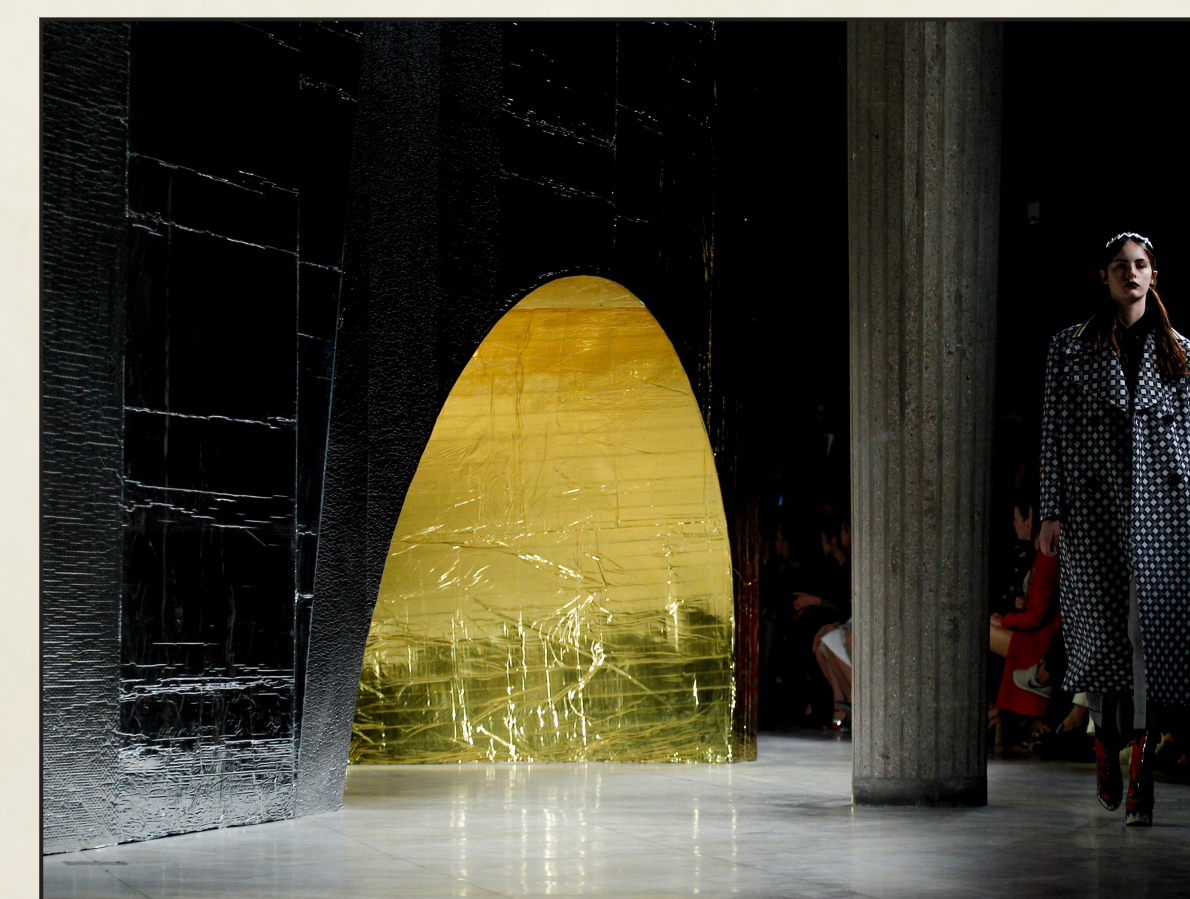
Fashion show di Miu Miu nel Palais d'Iéna a Parigi, 2011