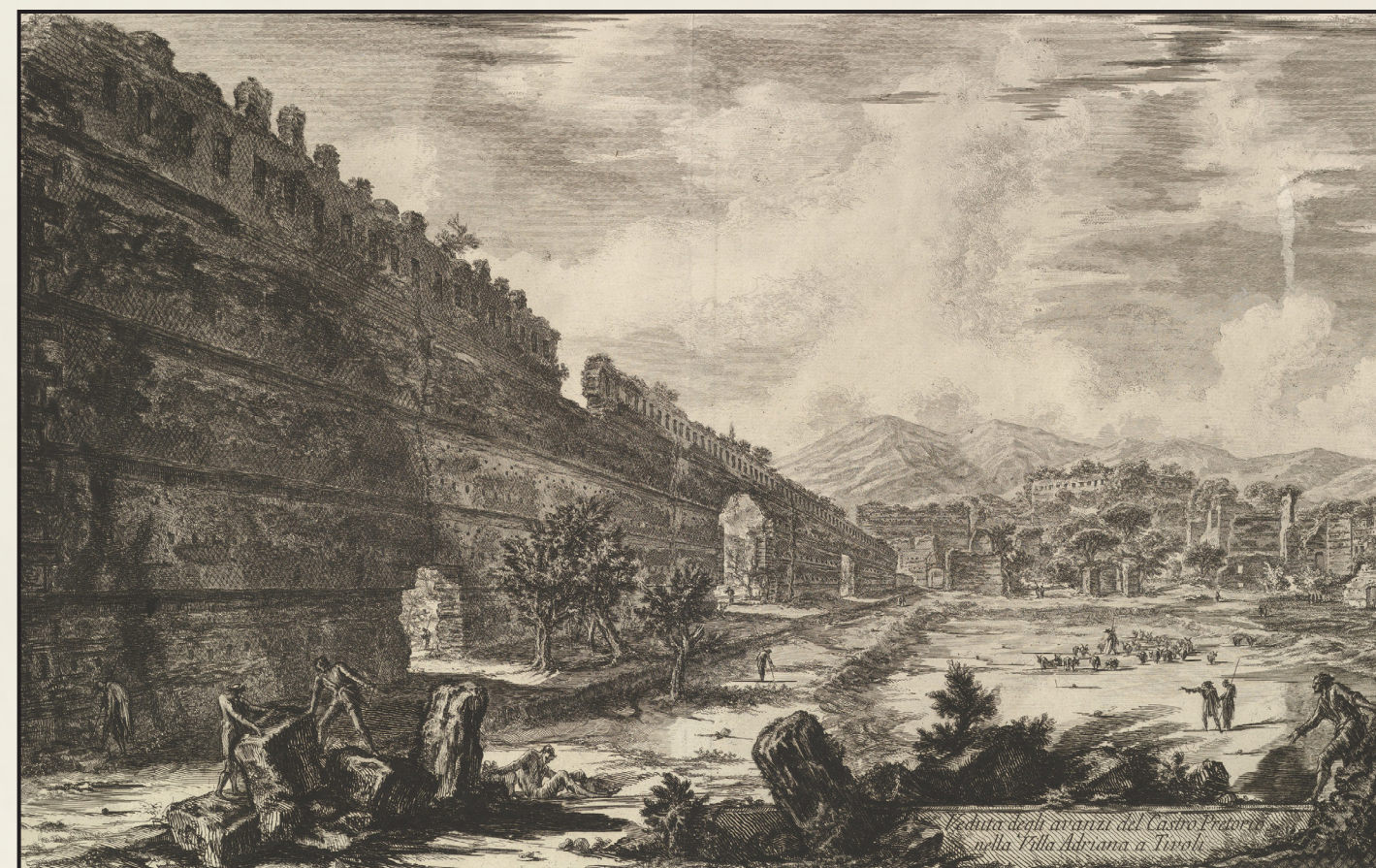
Giovanni Battista Piranesi - Veduta degli avanzi del Castro Pretorio nella Villa Adriana a Tivoli, 1770