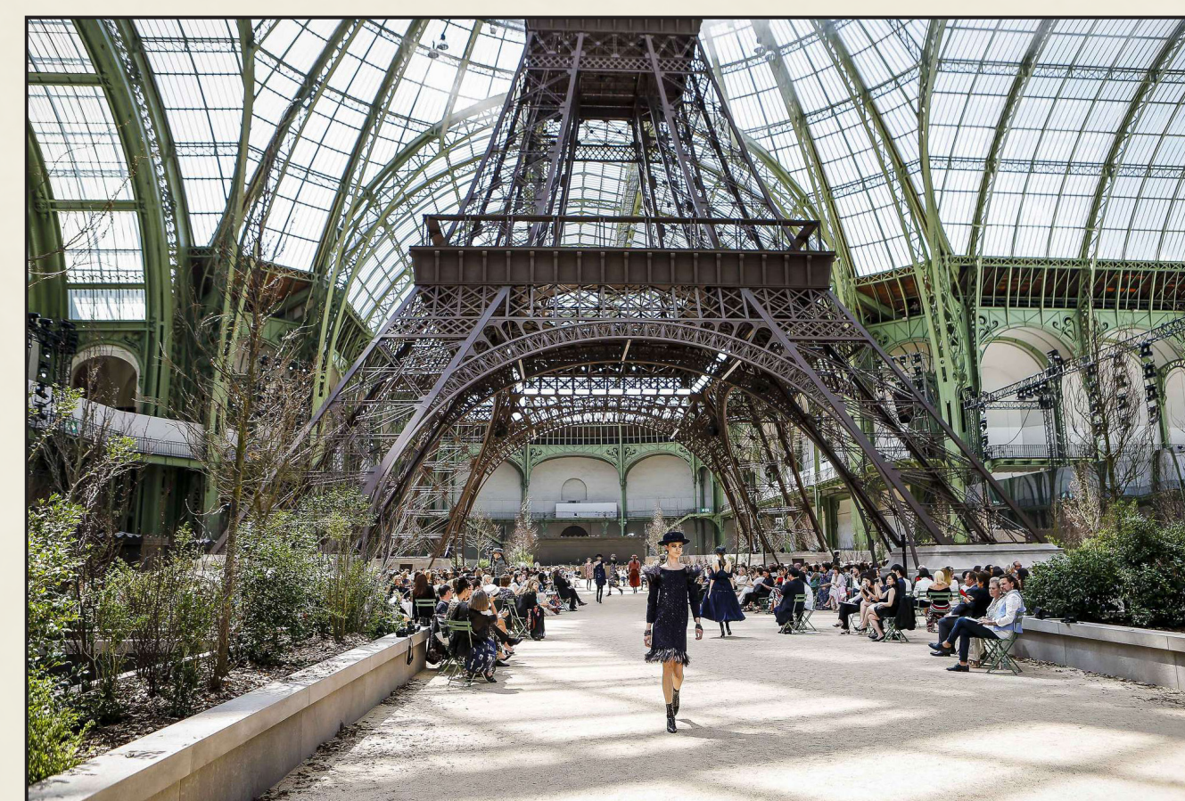
Fashion show di Chanel nel Gran Palais di Parigi per la collezione autunno/inverno 2017/2018