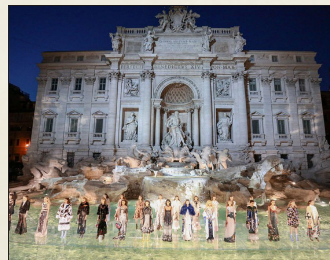
Fashion show di Fendi sulla Fontana di Trevi di Roma, 2016