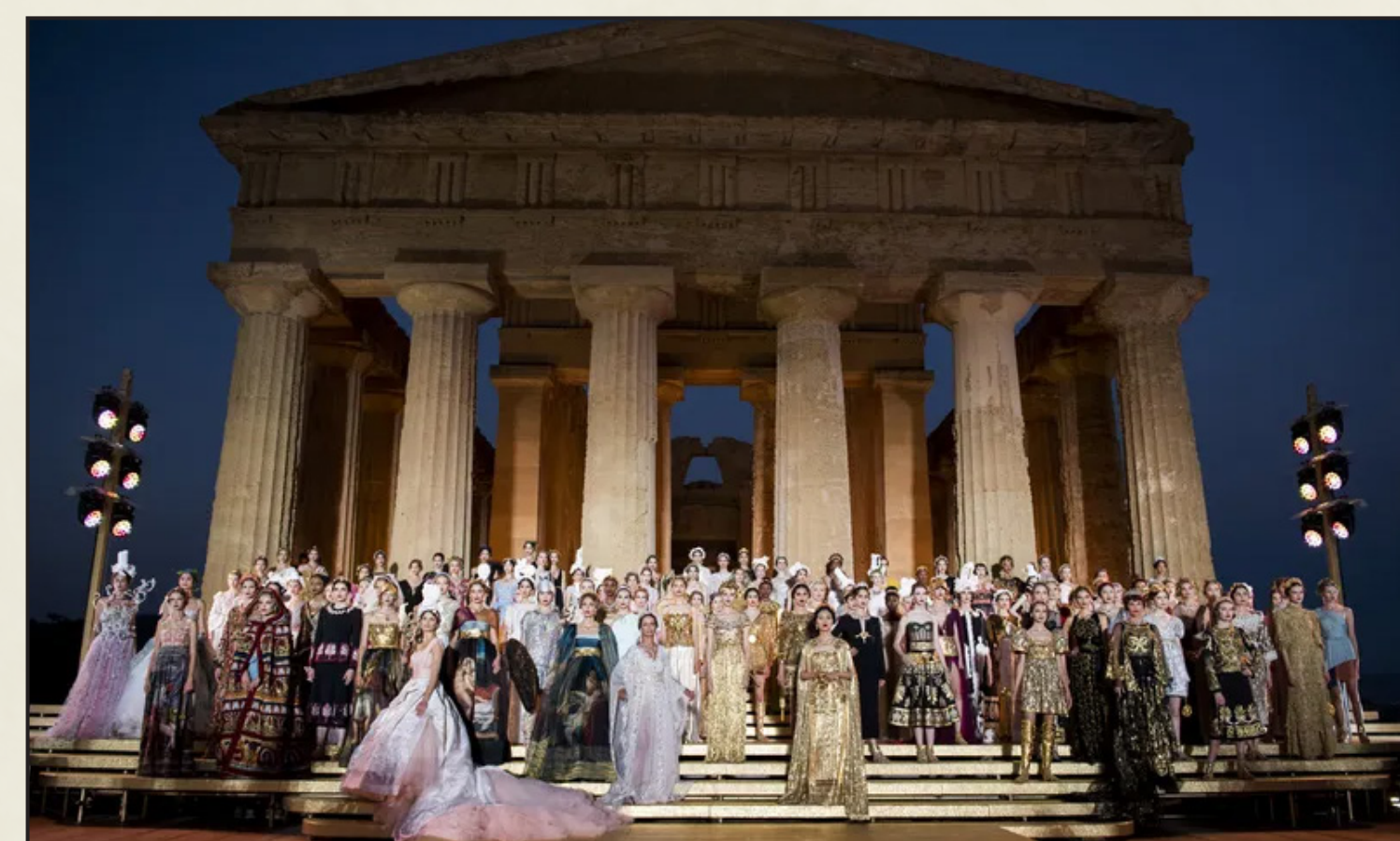
Fashion show di Dolce & Gabbana nel Tempio della Concordia ad Agrigento, 2019