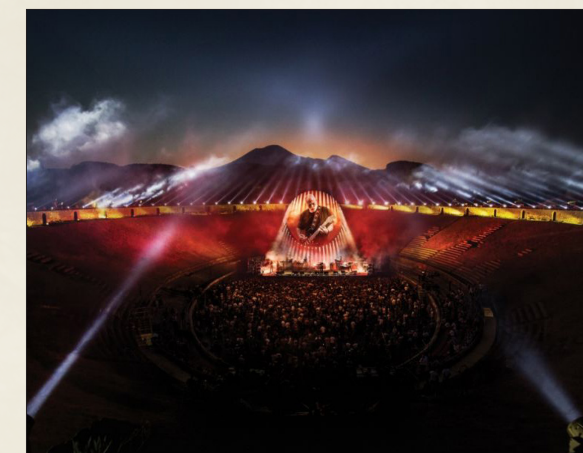
Concerto di David Gilmour all'interno dell'Anfiteatro di Pompei, 2016