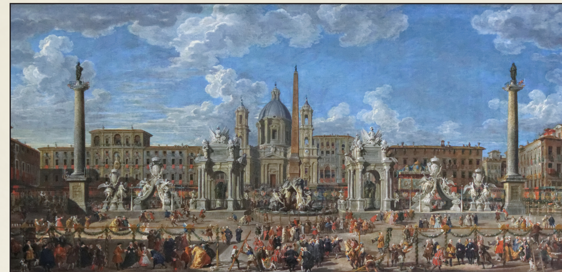
Giovanni Paolo Pannini - Piazza Navona a Roma, 1729