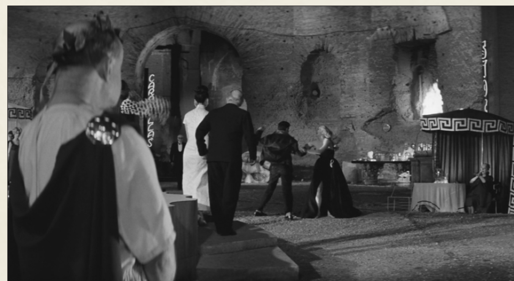
Scena del film "la dolce vita" di Federico Fellini all'interno delle Terme di Caracalla, 1960