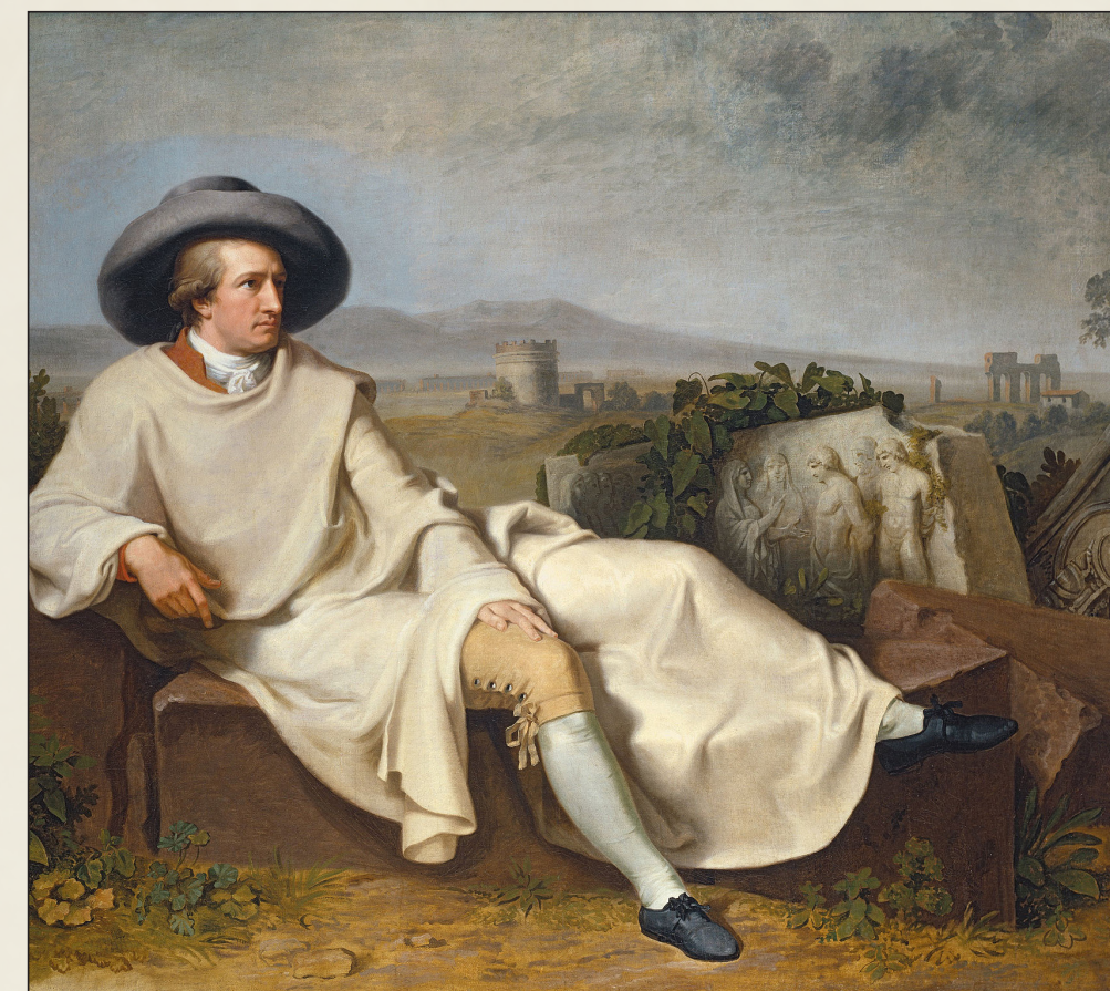
Johann Heinrich Wilhelm Tischbein - Goethe nella campagna romana, 1787