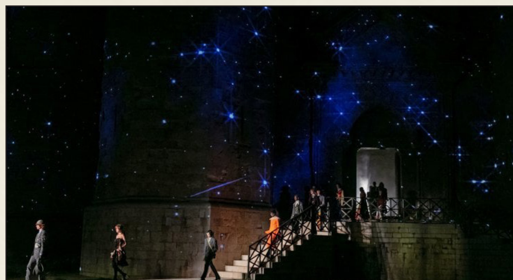
Fashion show di Gucci a Castel del Monte a Andria, 2022