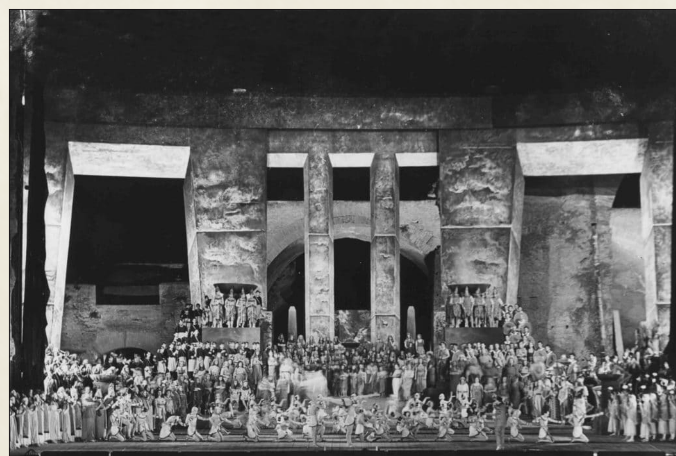
Lo spettacolo dell'Aida all'interno delle Terme di Caracalla, 1939