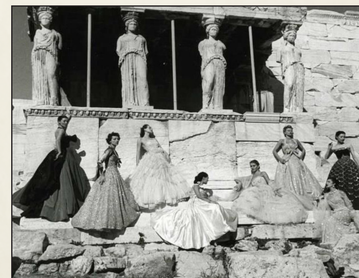
Servizio fotografico di Dior sull'Acropoli di Atene, 1951