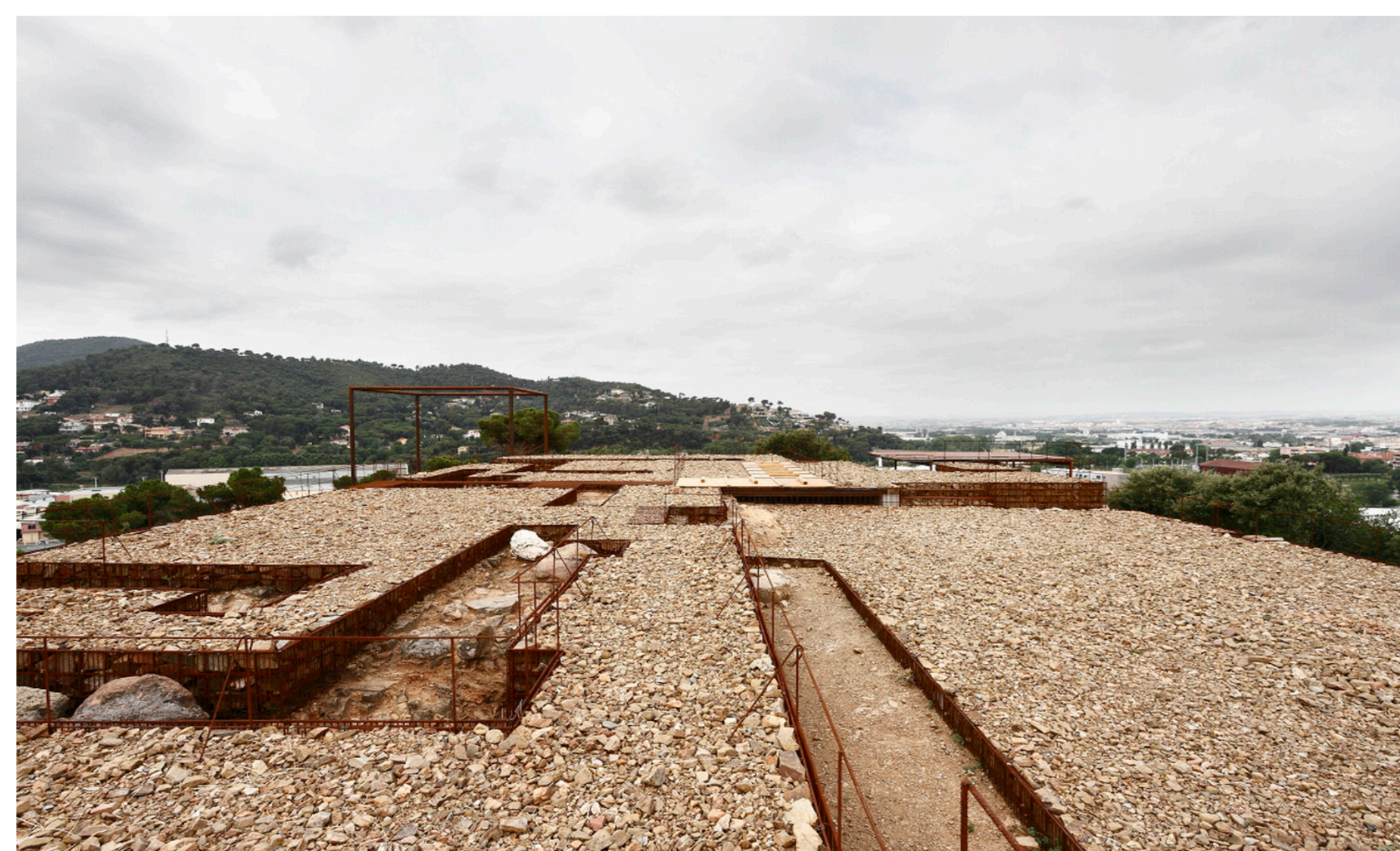
CIMITERO DI IGUALADA, Miralles e Pinos, Spagna, 1994

Trattamento progettuale e naturalistico della pavimentazione in pietra e terra battuta stabilizzata da intendere lungo i percorsi previsti nel parco archeologico.