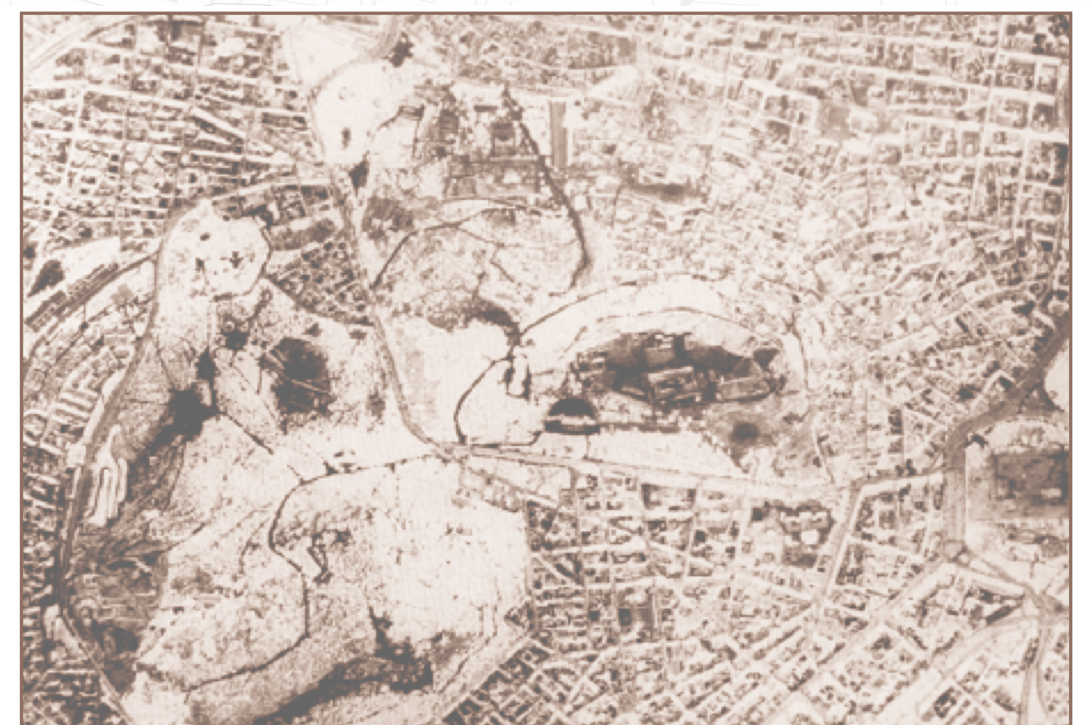
IMMAGINE AEREA DEL PARCO ARCHEOLOGICO DI ATENE DOPO IL PERCORSO DI PIKIONIS