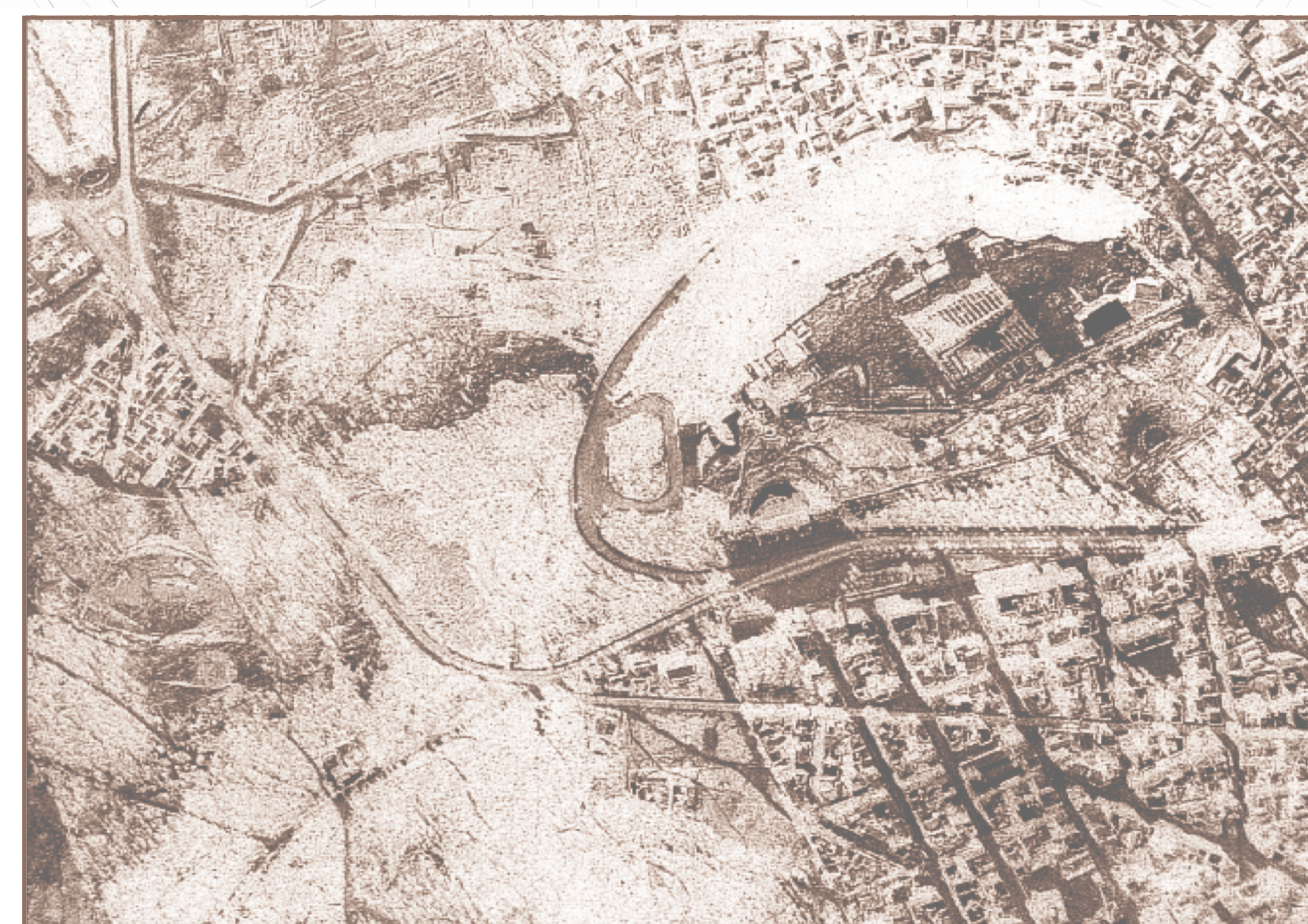
IMMAGINE AEREA DEL PARCO ARCHEOLOGICO DI ATENE PRIMA DEL PERCORSO DI PIKIONIS