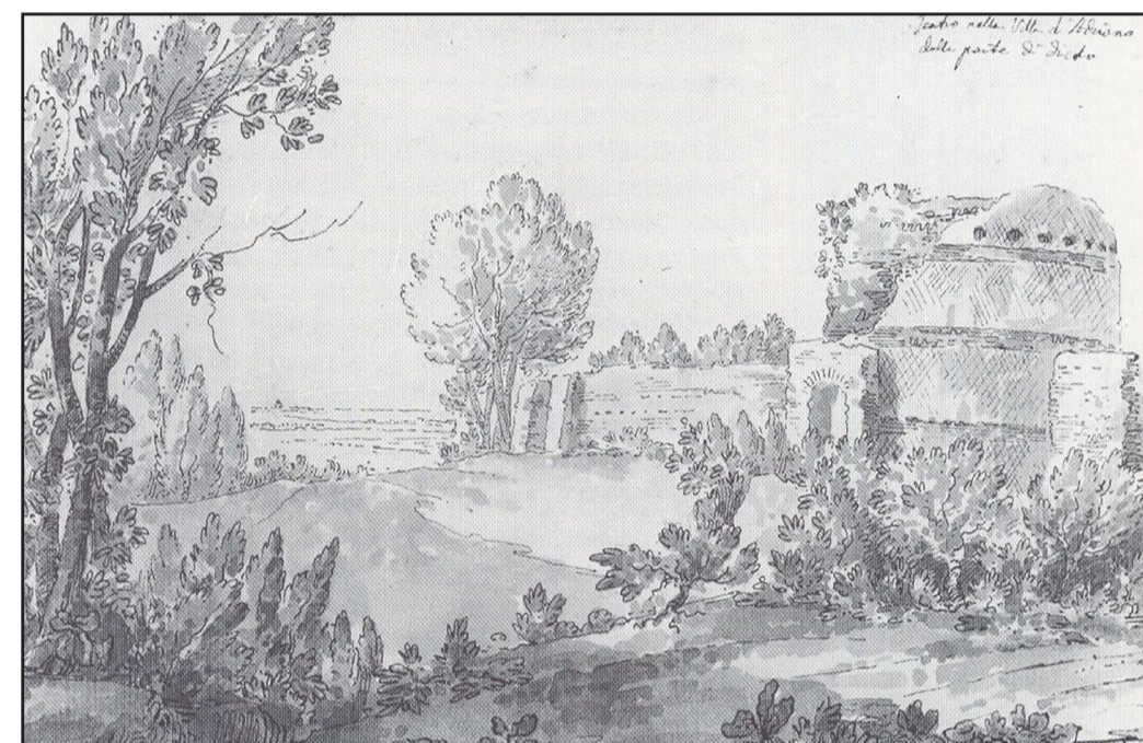
Giacomo Quarenghi 1777