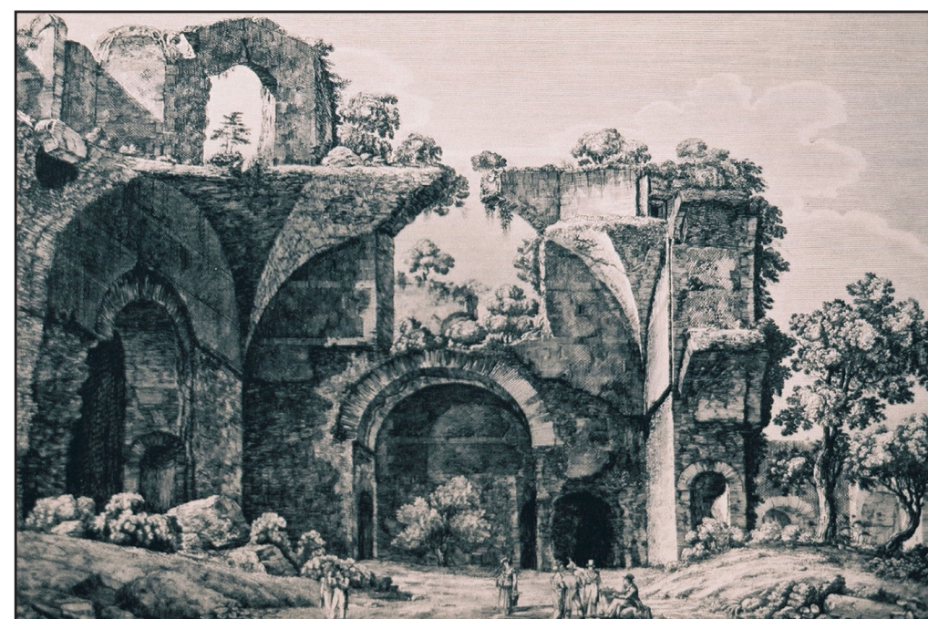
Luigi Rossini 1824