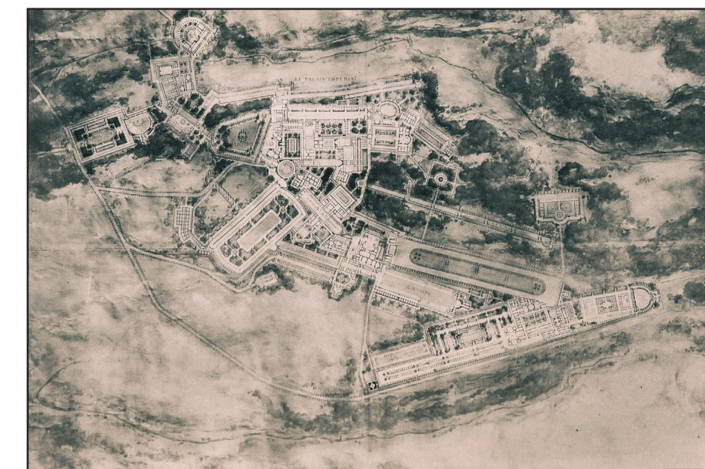
Charles Louis Boussois 1913

Inizio della costruzione di Villa Adriana nei pressi di Tivoli per volere dell'Imperatore Adriano. I lavori durarono per tutto il governo dell'Imperatore e alcune parti furono completate dopo la sua morte.