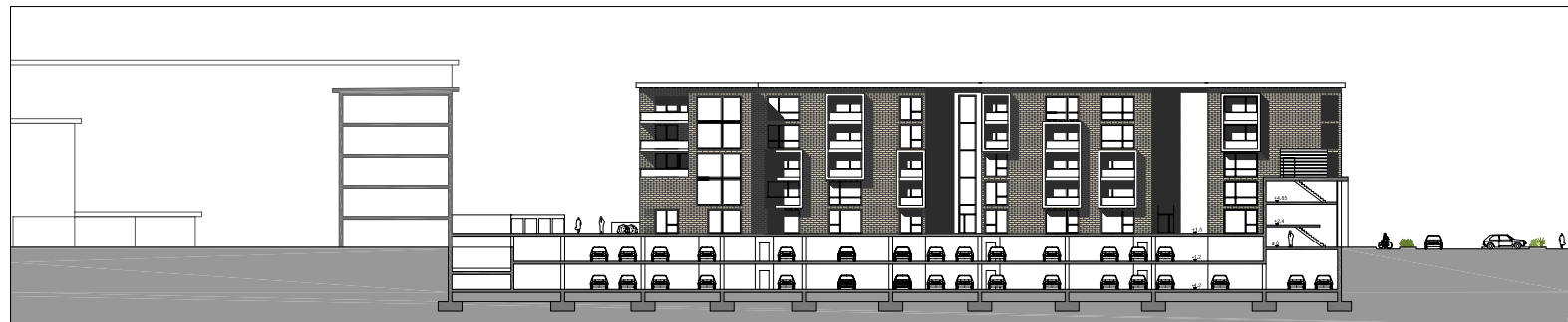
PROSPETTO BB' _ sud-ovest