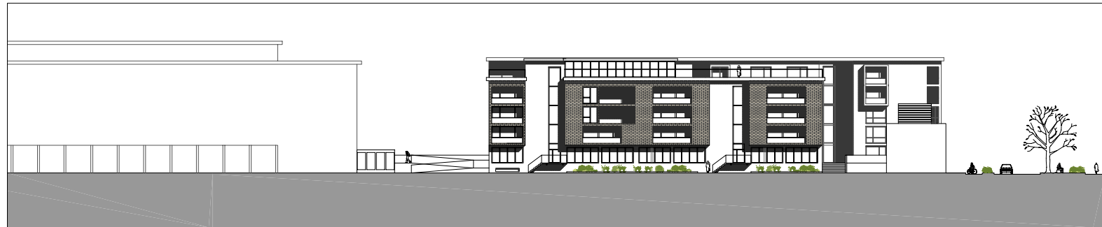
PROSPETTO AA' _ sud-ovest