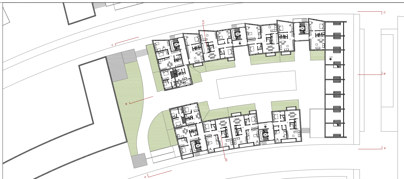
SECONDO PIANO +4.5m