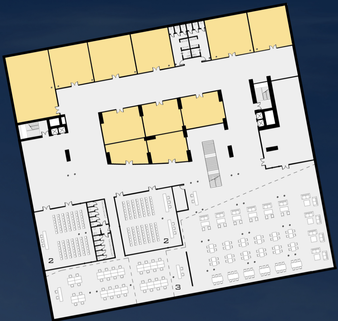
PIANTA QUOTA -5.00 INTERRATO 1:500