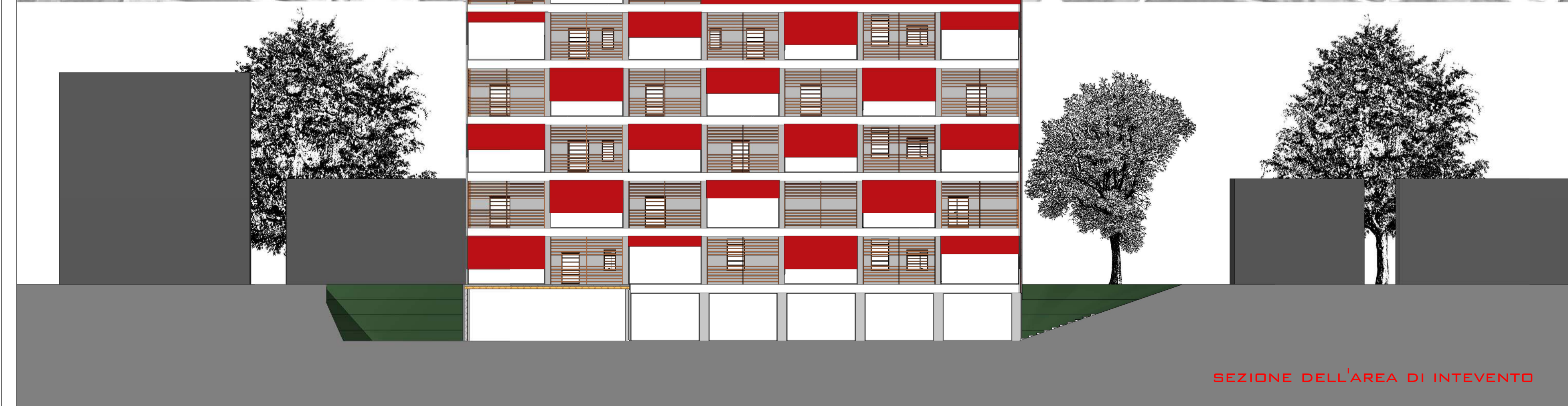
SEZIONE DELL'AREA DI INTEVENTO