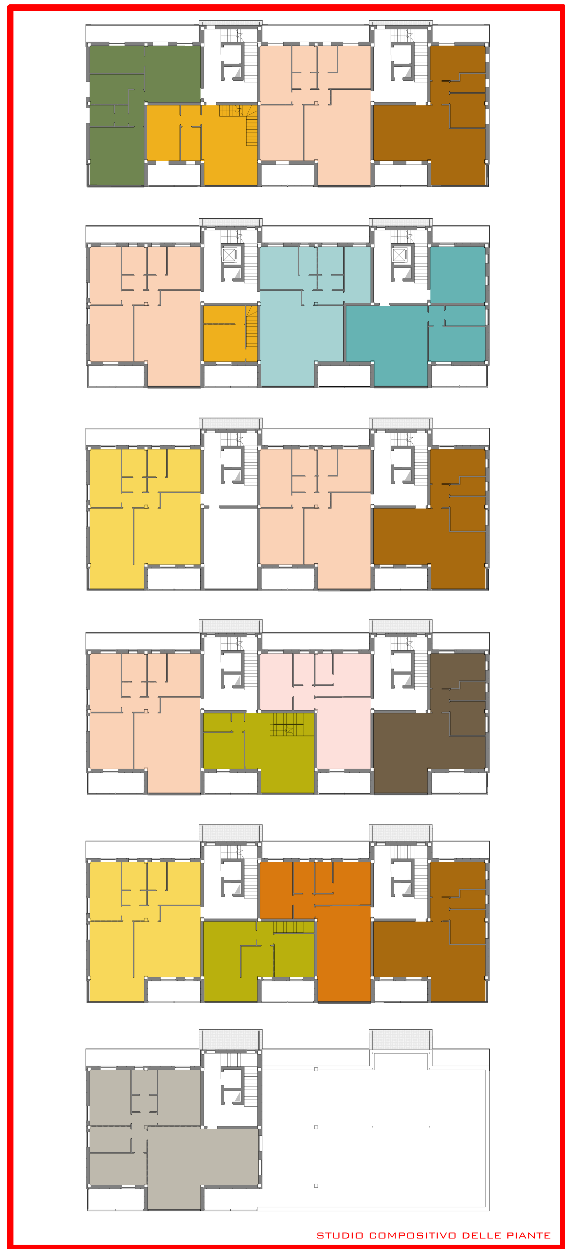
STUDIO COMPOSITIVO DELLE PIANTE