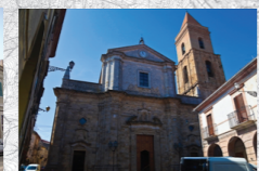
Chiesa Santa Maria Maggiore (Guglionesi)