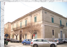
Palazzo Norante (Termoli)