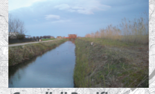
Canali di Bonifica