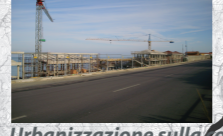
Urbanizzazione sulla costa