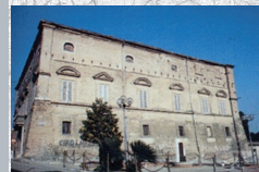
Palazzo Baronale Portocannone