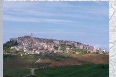
Sorgono i centri arroccati sulla collina