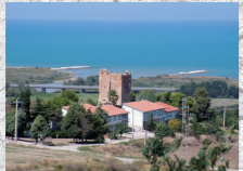
Torre di Avvistamento Costiero Montenero di Bisaccia