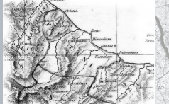
Cartografia Storica raffigurante le città Sannite