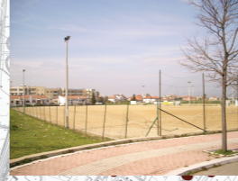
Concentrazione di Persone/Attività: Media

25) Verde Attrezzato e Campetto Sportivo