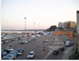
Concentrazione di Persone/Attività: Molto Alta