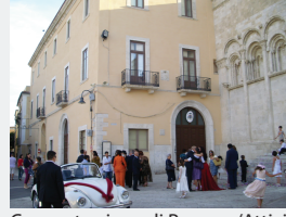
Concentrazione di Persone/Attività: Media