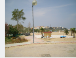
Concentrazione di Persone/Attività Bassa