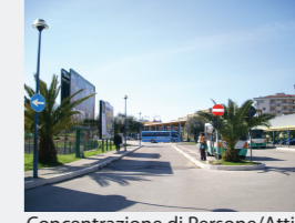
Concentrazione di Persone/Attività: Alta