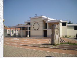
Concentrazione di Persone/Attività: Bassa