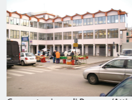
Concentrazione di Persone/Attività: Bassa