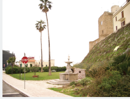
Concentrazione di Persone/Attività:Alta