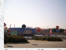
Concentrazione di Persone/Attività: Media