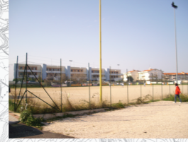
Concentrazione di Persone/Attività: Media

24) Verde Attrezzato e Campetto Sportivo