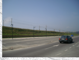
Concentrazione di Persone/Attività: Media