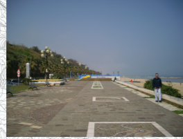
Concentrazione di Persone/Attività: Media