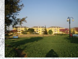
Concentrazione di Persone/Attività: Media

25) Verde Attrezzato e Campetto Sportivo