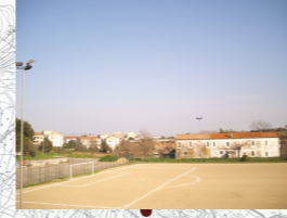
Concentrazione di Persone/Attività: Media

25) Verde Attrezzato e Campetto Sportivo