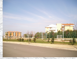
Concentrazione di Persone/Attività:Media