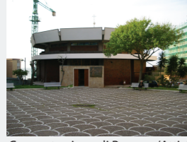
Concentrazione di Persone/Attività: Bassa