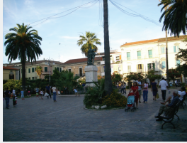
Concentrazione di Persone/Attività: Media