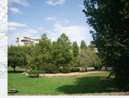
Concentrazione di Persone/Attività: Alta