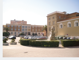
Concentrazione di Persone/Attività:Alta