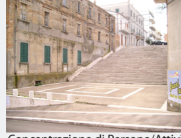
Concentrazione di Persone/Attività: Media