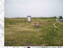
Concentrazione di Persone/Attività:Media