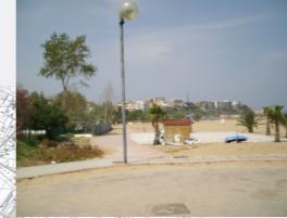
Concentrazione di Persone/Attività Bassa