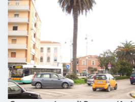
Concentrazione di Persone/Attività: Alta