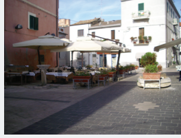
Concentrazione di Persone/Attività: Alta