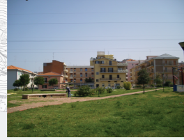
Concentrazione di Persone/Attività: Media