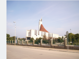
Concentrazione di Persone/Attività: Media