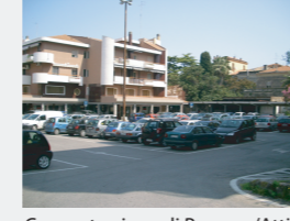
Concentrazione di Persone/Attività: Bassa