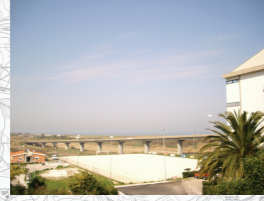
Concentrazione di Persone/Attività: Media