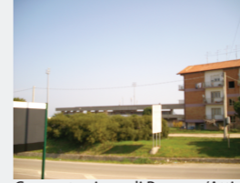
Concentrazione di Persone/Attività: Alta