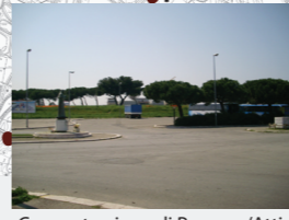
Concentrazione di Persone/Attività: Media