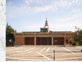
Concentrazione di Persone/Attività: Bassa