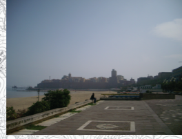
Concentrazione di Persone/Attività: Media