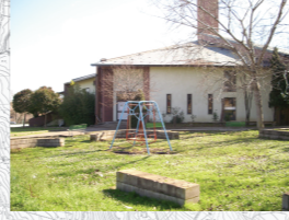
Concentrazione di Persone/Attività: Media

24) Verde Attrezzato e Campetto Sportivo