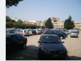
Concentrazione di Persone/Attività: Media