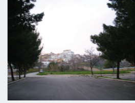
Concentrazione di Persone/Attività Bassa