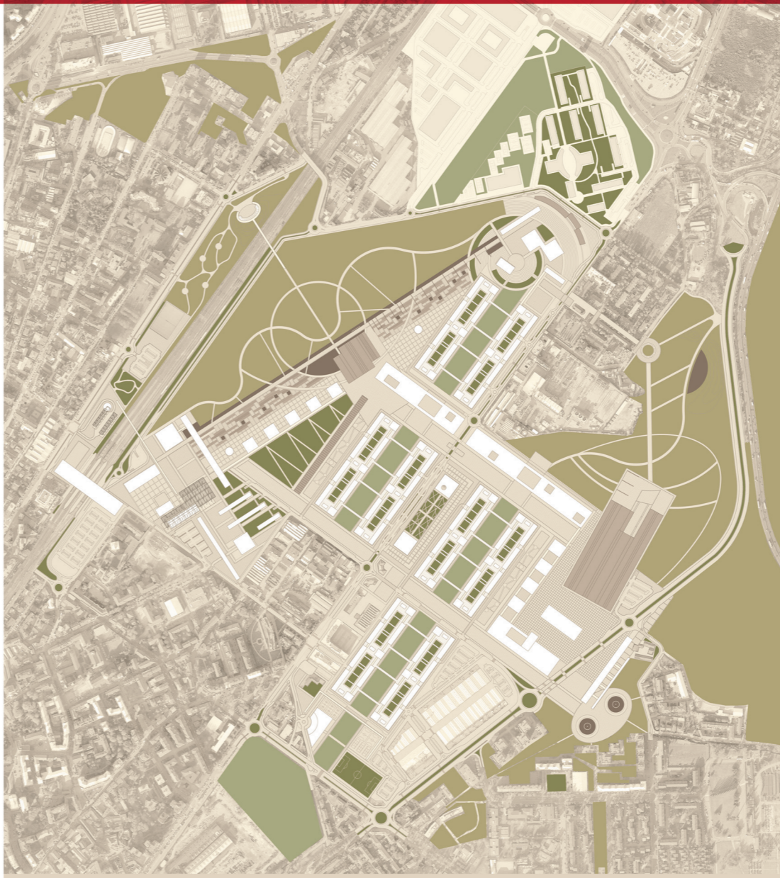
Sistema del Verde

Sistema di percorsi in continuità Assi principali Percorsi nel verde Fulcri notevoli