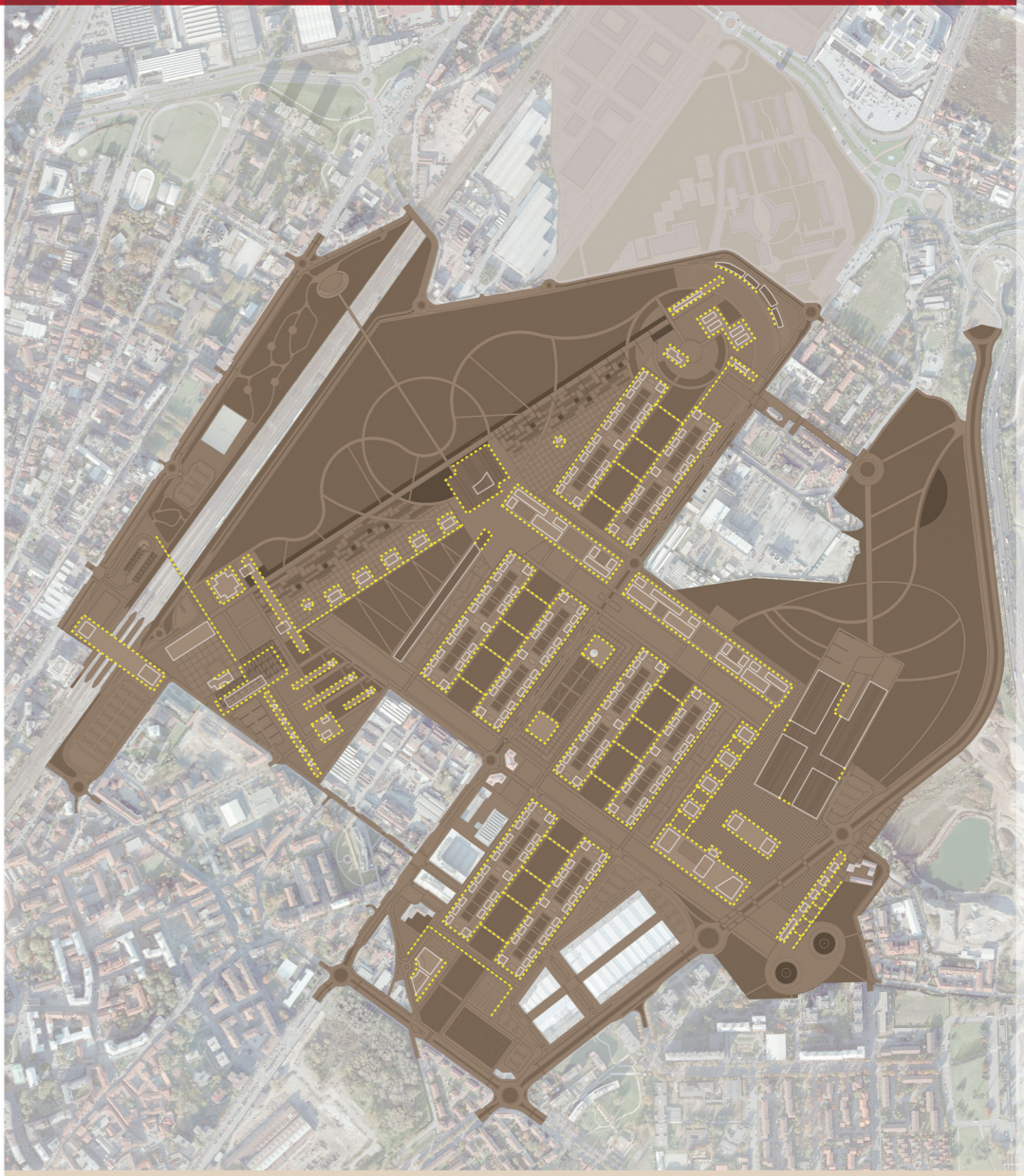
Soglie, Penombre, Interferenze, Permeabilità

Sistema del verde - est-ovest di interesse sovacomunale Sistema del verde - nord-sud di interesse sovacomunale Verde di interesse comunale