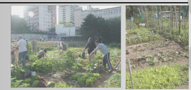
ORTI URBANI: disposti lungo il perimetro del lotto in continuità con i preesistenti orti urbani spontanei. Elemento di condivisione sociale e aggregazione per una cultura del vivere insieme.