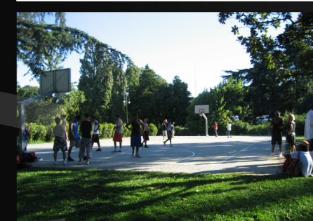
CAMPO DA BASKET