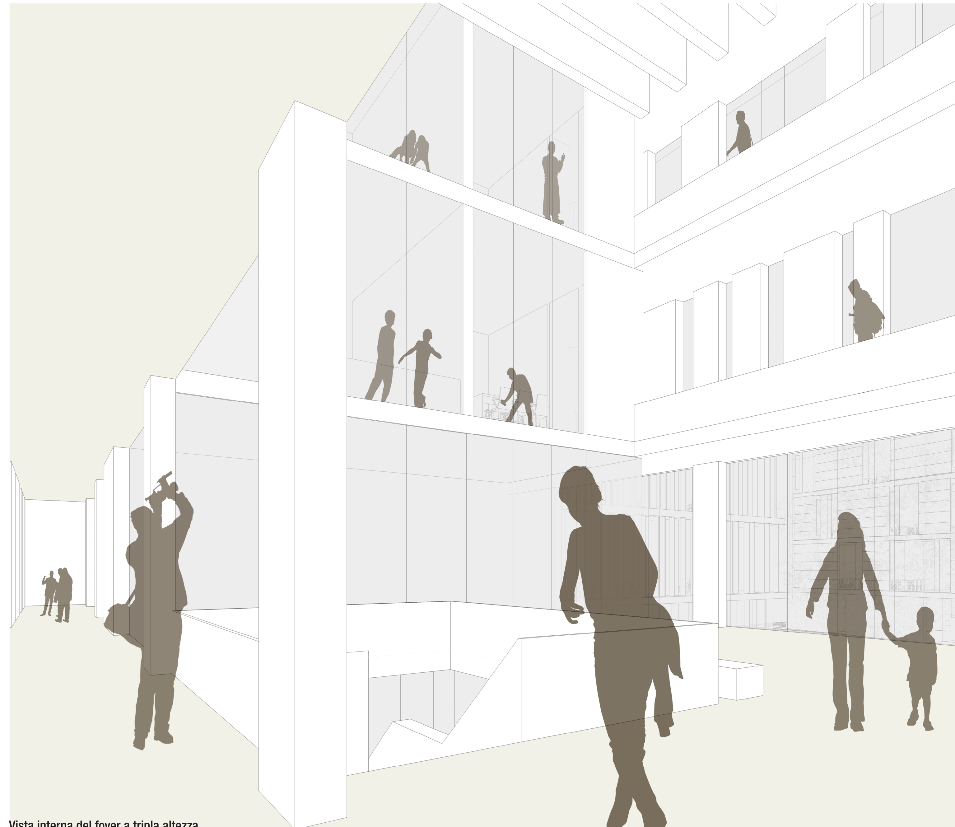
Vista interna del foyer a tripla altezza