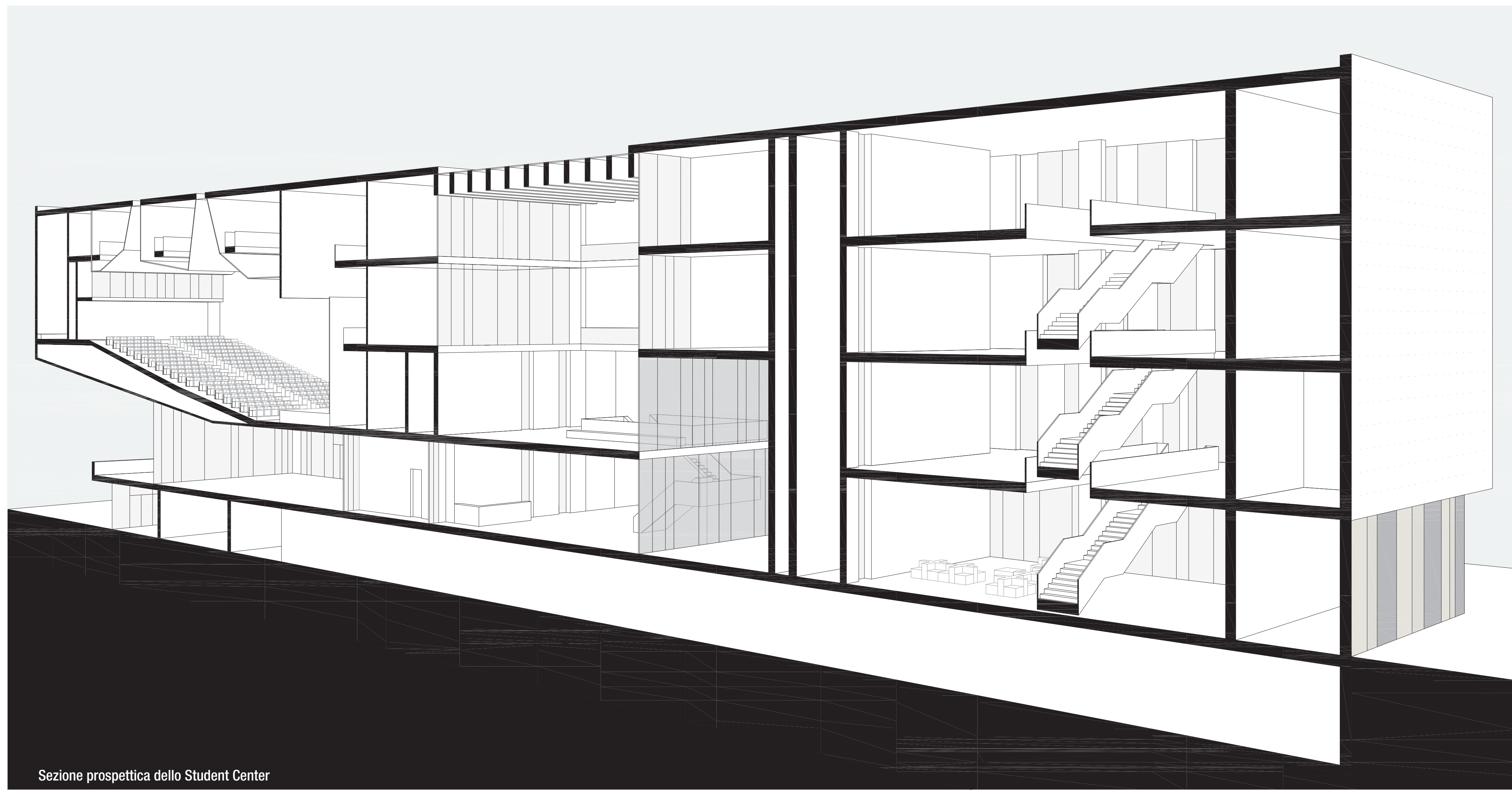
Sezione prospettica dello Student Center