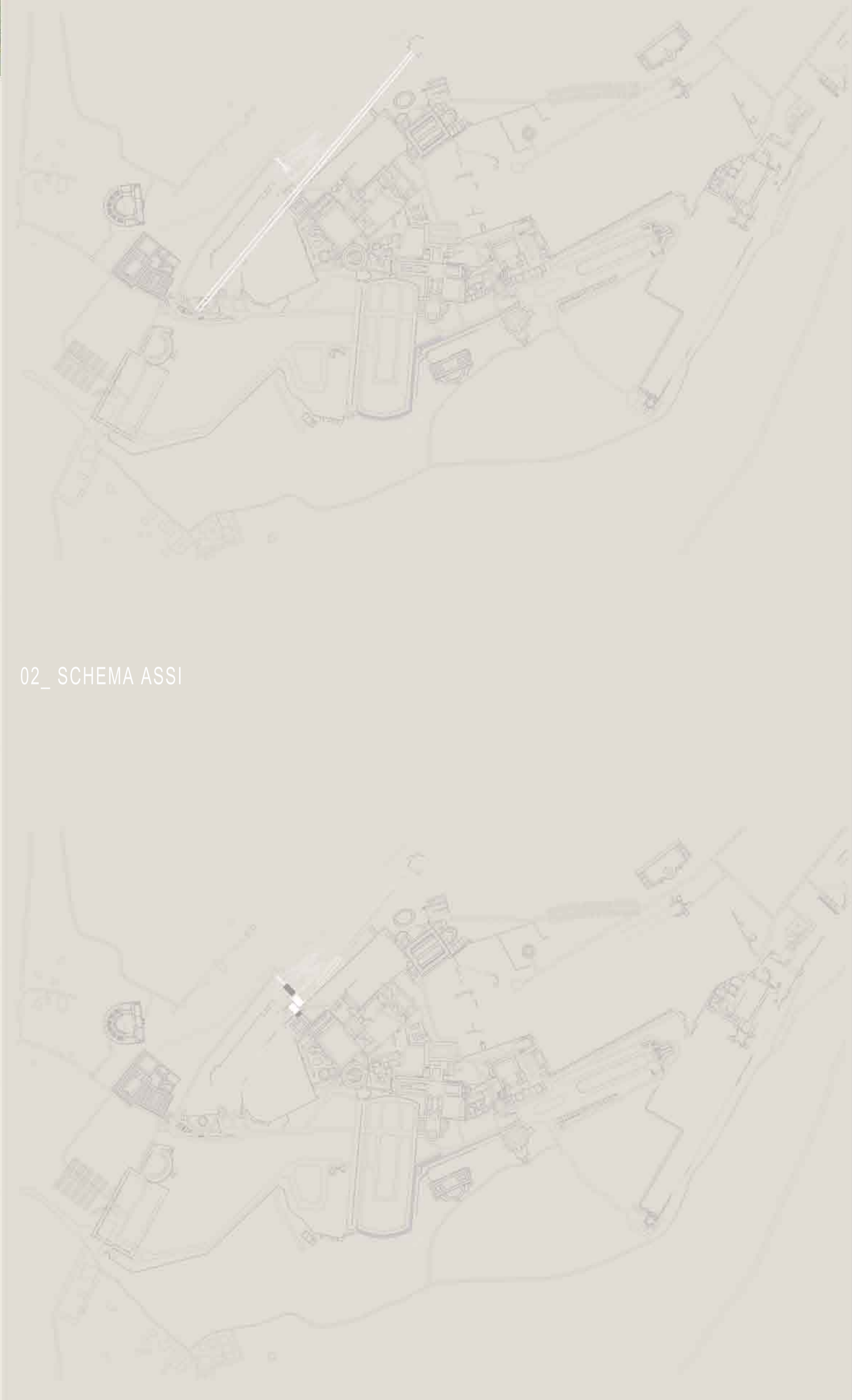
02_ SCHEMA ASSI