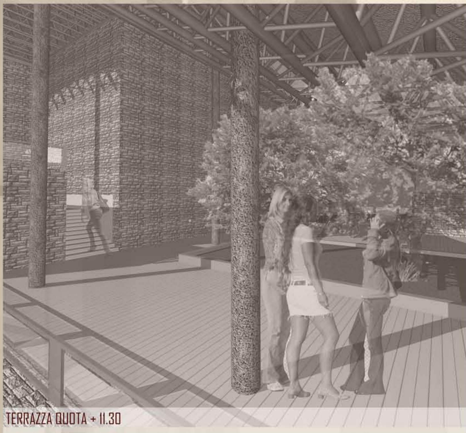
TERRAZZA QUOTA + 11.30