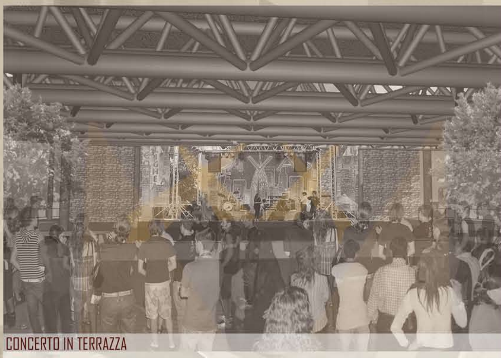
CONCERTO IN TERRAZZA