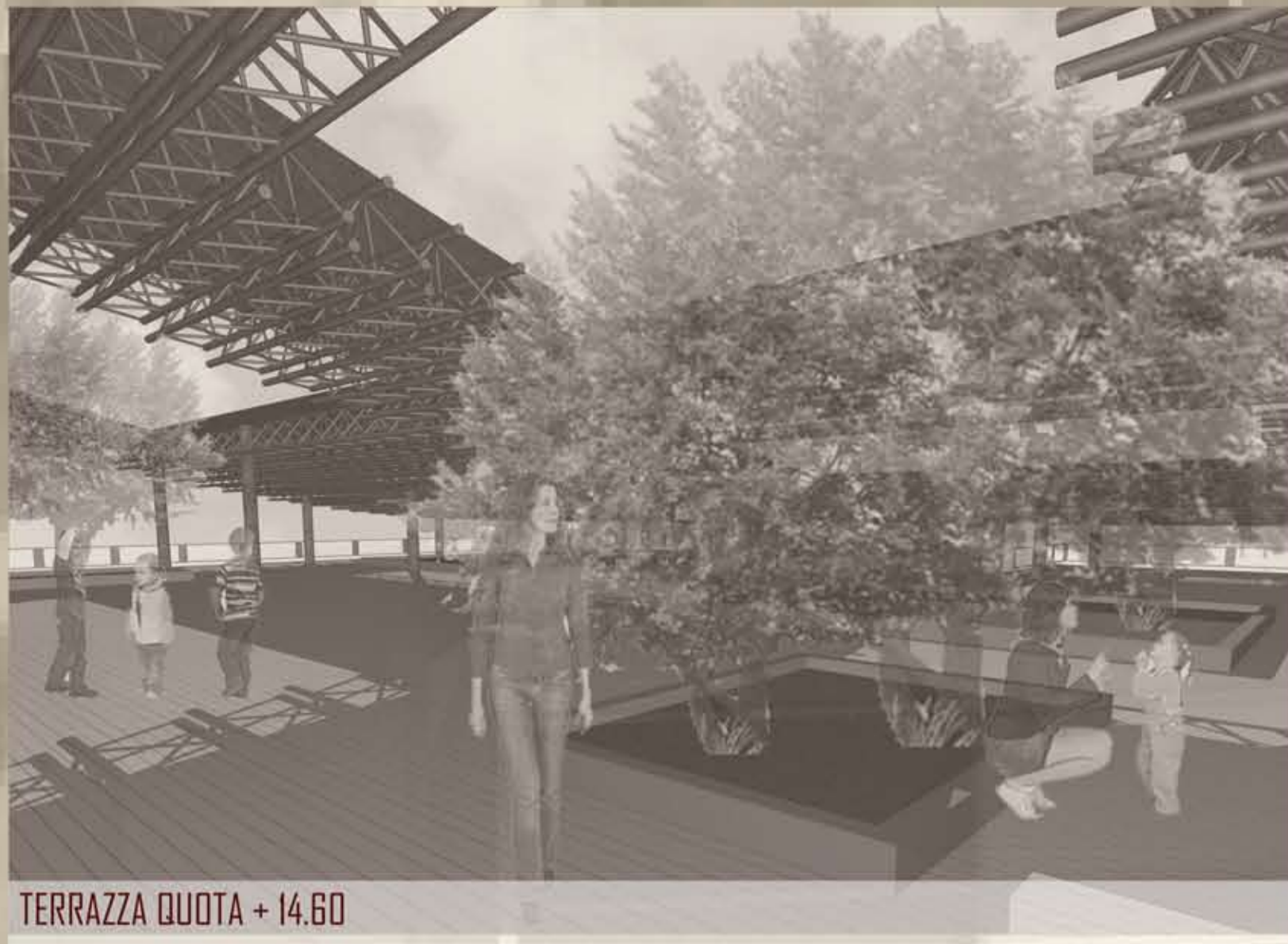
TERRAZZA QUOTA + 14.60