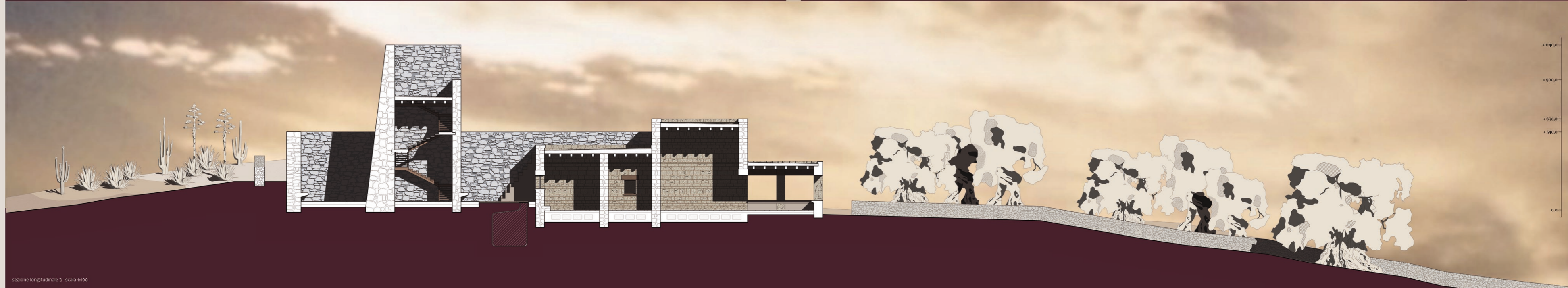
sezione longitudinale 3 - scala 1:100