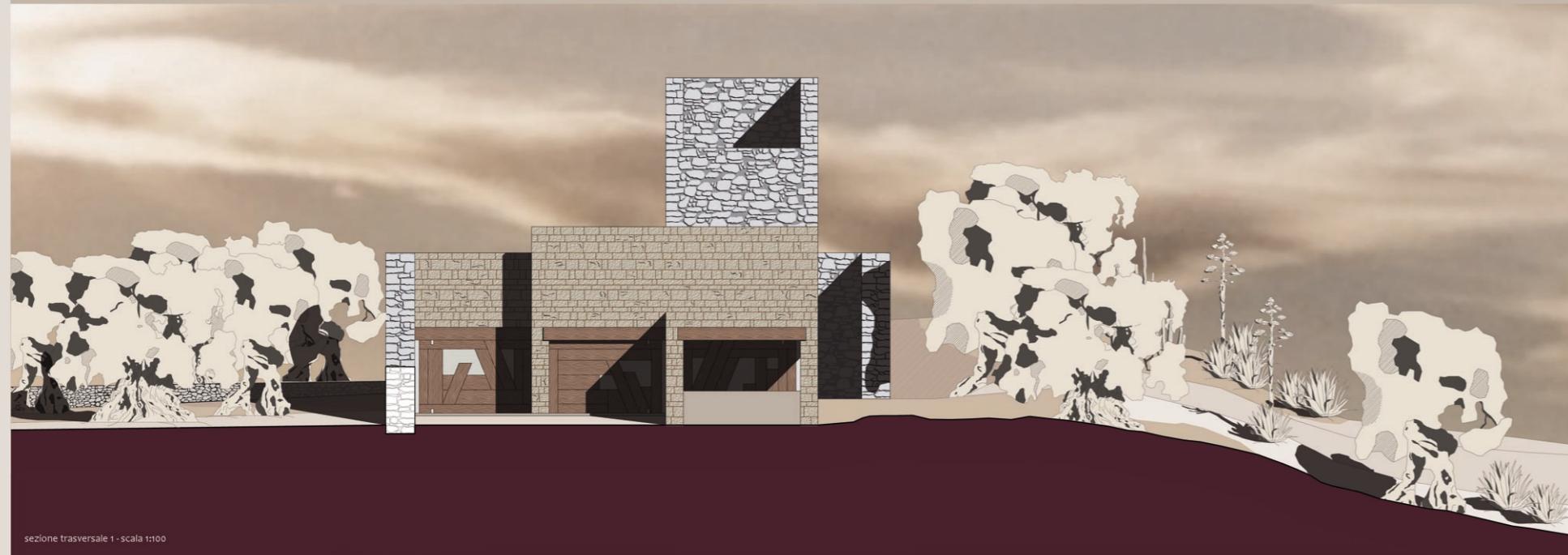
sezione trasversale 1 - scala 1:100