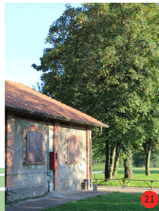
ABBEVERATOIO 1893 STATO ORIGINARIO: aperto su tutti i lati ospitava due vasche simmetriche. STATO ATTUALE fortemente modificato nel 1985 ha ospitato sedi di associazioni, nuovamente modificato nel 2000, è oggi utilizzato come cucina e bar.