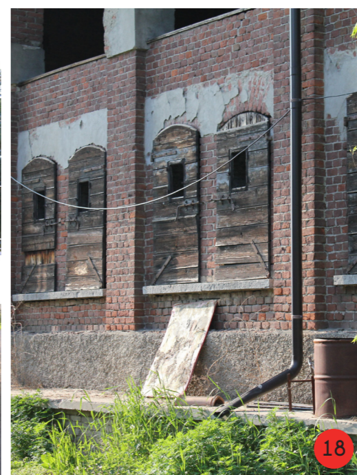
STALLE E FIENILE 1800 STATO ORIGINARIO: parte di una cascina quadrangolare di cui si hanno solo poche tracce in alcuni disegni a china. STATO ATTUALE dall'aspetto esteriore invariato, dal 1970 di proprietà comunale ospita un deposito.