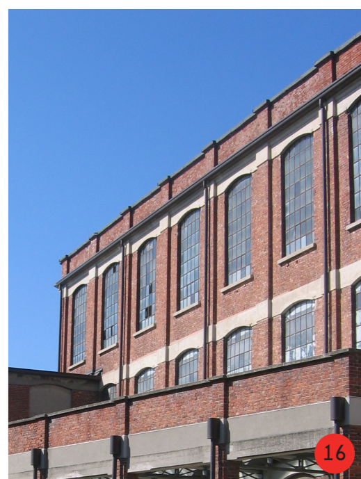
EDIFICIO SUD dal 1857 al 1960 STATO ORIGINARIO: la parte est, presente nel 1857 fu abbattuta e sostituita da un edificio a tre piani fuori terra, il piano oggi interrato era fuori terra fino al 1960. STATO ATTUALE fortemente modificato sia internamente che esternamente (nelle aperture), ospita il PST.