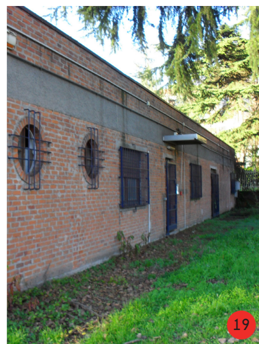
LABORATORIO ARTIGIANALE 1970 STATO ORIGINARIO: costruito per ospitare un laboratorio di falegnameria. STATO ATTUALE internamente ed esteriormente invariato, l'attività è cessata nel 2009, è prevista la costruzione di un'area a parcheggio.