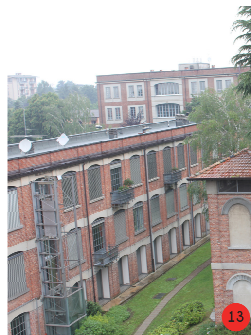
FILATOIO dal 1857 al 1930 STATO ORIGINARIO: dalla fama rettangolare con lato minore di poco più di 4m ospitava le macchine per la filatura del cotone. STATO ATTUALE ristrutturato alla fine del 1970 per ospitare 3 unità abitative, ha subito modificazioni esterne.