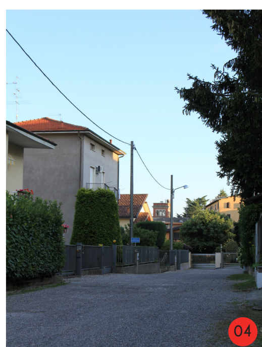
CASE COLONICHE 1860 STATO ORIGINARIO: esistenti prima della della fondazione del villaggio operaio, complesso di più cascinie lombarde con annessi STATO ATTUALE completamente demolite agli inizi del 1960, sostituite da ville singole o bifamiliari.