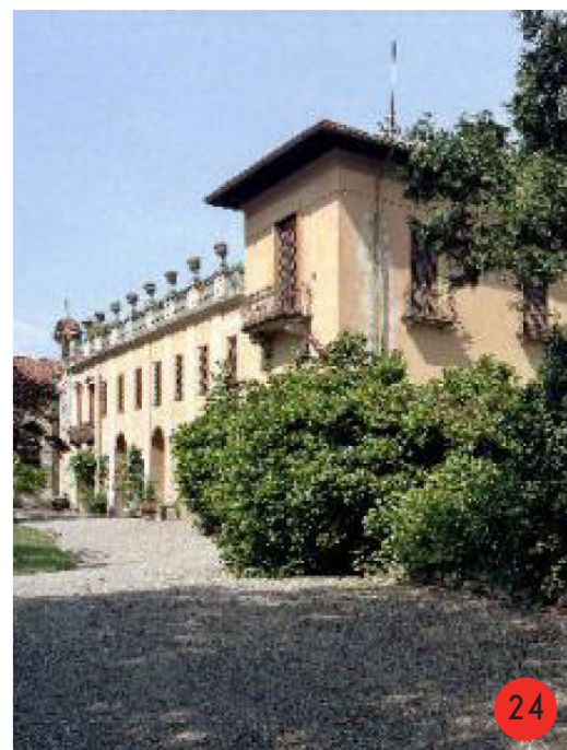
VILLA CARCANO RAIMONDI 1400 STATO ORIGINARIO: comprende diversi edifici ed un parco con piante secolari, affrescato da Giulio Romano, sottoposta a vincolo nel 1939. STATO ATTUALE abitata dai discendenti di Francesco Somaini, in buono stato di conservazione.