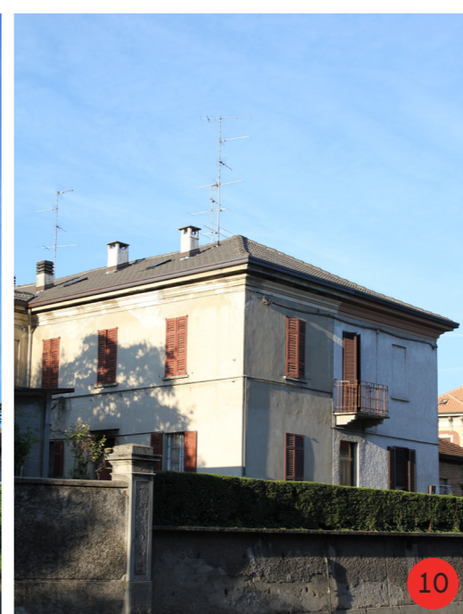
CASA COLONICA 1908 STATO ORIGINARIO: abitata da 4 unità familiari, comprendeva un piccolo orto per ogni unità. STATO ATTUALE dall'aspetto esteriore invariato, profondamente modificato all'interno, sono ancora presenti tracce degli orti originali.