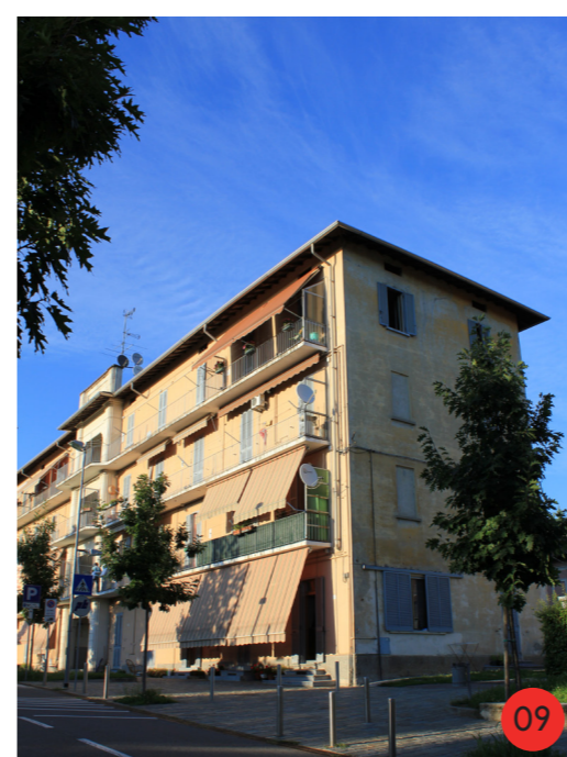
CASE A BALLATOIO 1907 STATO ORIGINARIO: 80 vani adibiti a portineria, in affitto per operai con famiglia, sottotetto adibito a deposito e scantinato comune. STATO ATTUALE dall'aspetto esteriore parzialmente invariato, ristrutturata di recente, ospita ancora residenze.