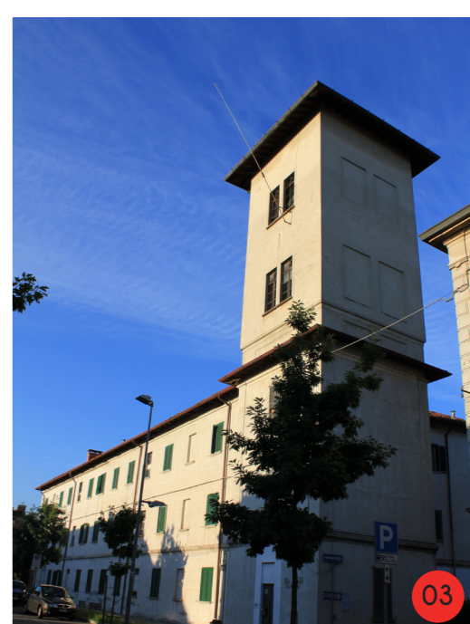
CASE A BALLATOIO 1908 STATO ORIGINARIO: 84 vani in affitto per operai con o senza famiglia, comprendeva una torre con cisterna per la distribuzione dell'acqua agli alloggi. STATO ATTUALE dall'aspetto esteriore invariato, è occupato da case popolari, ancora presente la torre.