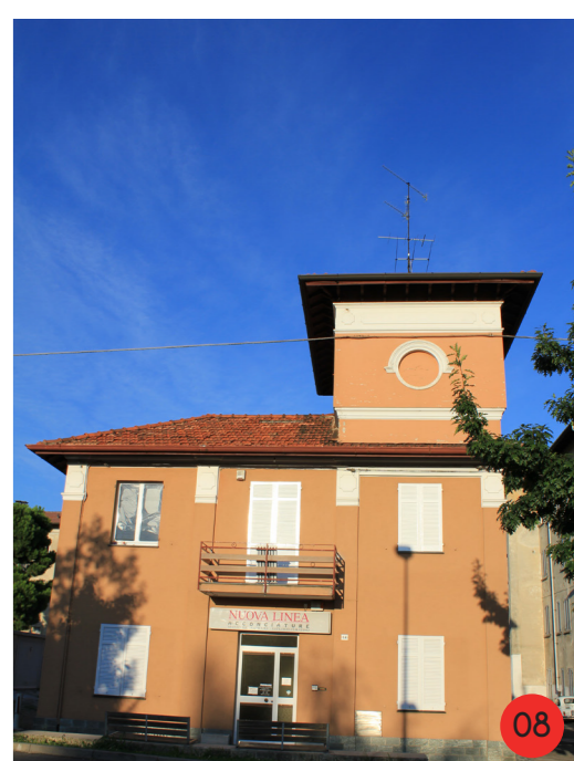
BAGNI PUBBLICI E LAVATOIO 1909 STATO ORIGINARIO: 18 vani destinati a bagni pubblici e lavatoi, con annessa piccola torre per serbatoio acqua. STATO ATTUALE profondamente modificato da attività commerciali e autorimesse.