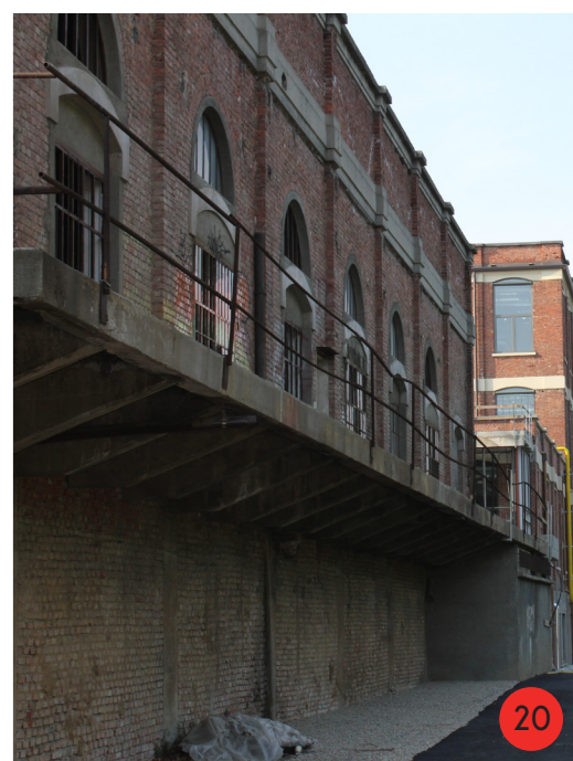
SCALO MERCI 1893 STATO ORIGINARIO: posizionato a lato di un binario dedicato all'arrivo di convogli privati. STATO ATTUALE di proprietà comunale è stato lievemente modificato, ha ospitato le sedi di diverse associazioni, del binario non rimane traccia.