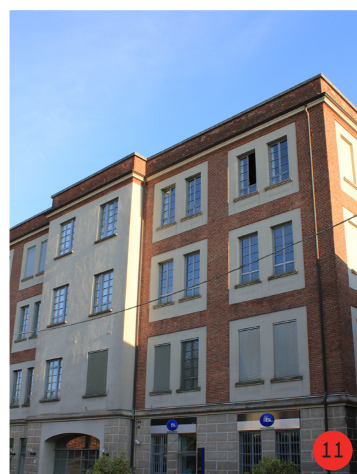
CONVITTO 1901 STATO ORIGINARIO: gestito da suore era dedicato alle ragazze senza famiglia, comprendeva una piccola cappella privata per le operarie. STATO ATTUALE esteriormente ristrutturato di recente, ospita attività commerciali e terziarie.