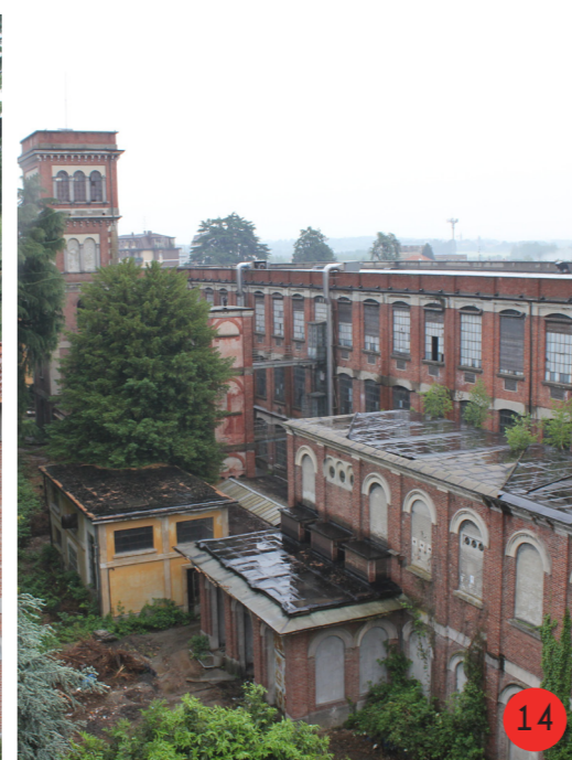
EDIFICIO NORD dal 1857 al 1960 STATO ORIGINARIO: ospitava le tresse di battitura, stoccaggio, self-ozing, corde, banchi, la centrale termica e le caldaie, prima a vapore poi a combustibile fossile. STATO ATTUALE dall'aspetto esteriore invariato, abbandonato.