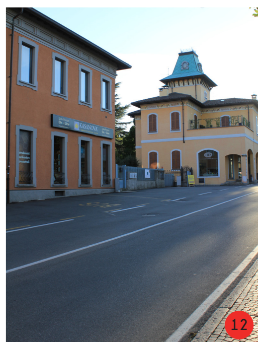
PORTINERIA E UFFICI 1897 e 1930 STATO ORIGINARIO: l'edificio a est ospitava gli uffici, l'edificio a ovest la portineria e l'alloggio del portiere. STATO ATTUALE dopo la chiusura dell'attività nel 1974, sono stati abbandonati, agli inizi del 2000 modificato fortemente per inserire uno show-room.