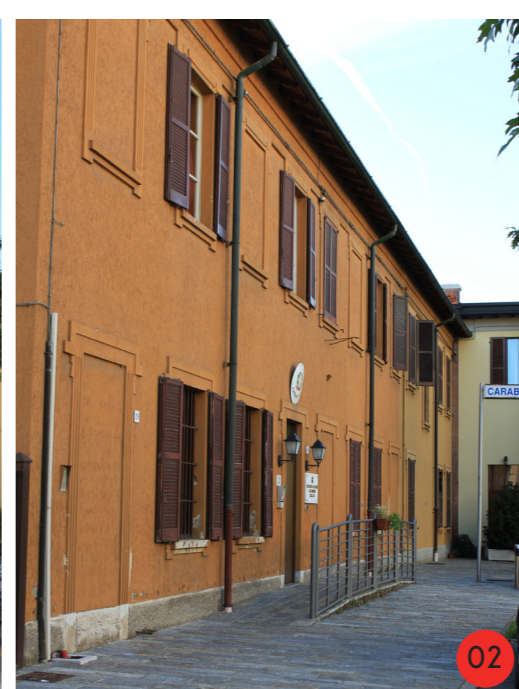
VILLETTE A SCHIERA 1908 STATO ORIGINARIO: 18 vani in affitto per operai con famiglia, ogni unità aveva a disposizione un piccolo orto. STATO ATTUALE dall'aspetto esteriore lievemente modificato, internamente fortemente modificato per ospitare la caserma dei Carabinieri.