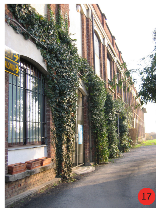
FILATOIO 1893 STATO ORIGINARIO: costruito sulla traccia di una cascina quadrangolare, di cui mantiene la giacitura. STATO ATTUALE fortemente modificato all'interno e in parte anche all'esterno ospita diverse attività commerciali e in parte residenze, abbandonato.