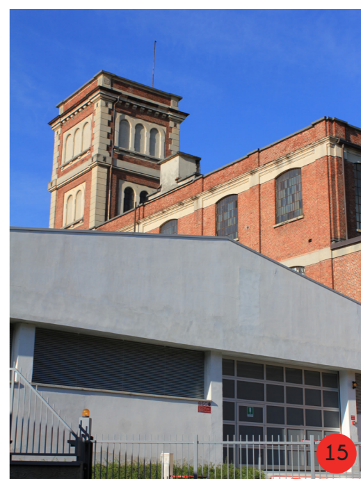
MAGAZZINO 1960 STATO ORIGINARIO: affiancato all'edificio sud, ha comportato la chiusura di parte delle aperture dello stesso, collegato al parcheggio interrato. STATO ATTUALE mantiene aspetto e funzione originarie.