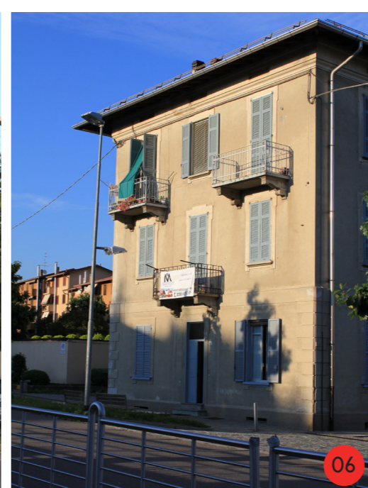
CASE A BALLATOIO 1920 STATO ORIGINARIO: 96 vani adibiti a portineria, in affitto per operai con famiglia, sottotetto adibito a deposito. STATO ATTUALE dall'aspetto esteriore invariato, le opere compiute sugli interni hanno epoche differenti e con modalità non omogenee.