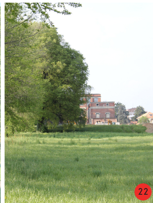
PARCO 1857 STATO ORIGINARIO: mantenuto a prato per l'allevamento di ovini, bovini e suini per la produzione di alimenti per la famiglia dei proprietari e per gli operai. STATO ATTUALE dopo anni di abbandono alla fine del 1980 ne inizia l'utilizzo per feste di paese.