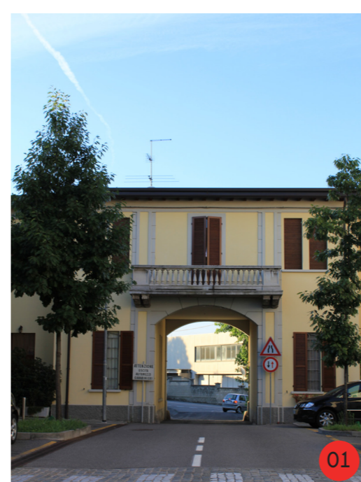
PORTINERIA 1920 STATO ORIGINARIO: 14 vani adibiti a portineria, e alloggio del portiere, permetteva la chiusura notturna del viale grazie ad un cancello. STATO ATTUALE dall'aspetto esteriore invariato, ristrutturata di recente ospita gli alloggi dei Carabinieri.