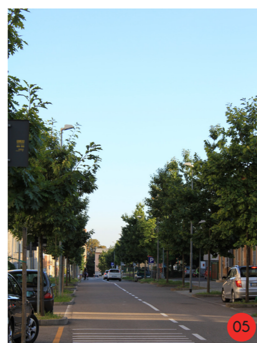
VIALE ALBERATO 1900 STATO ORIGINARIO: strada a due corsie in terra battuta affiancata da filari di Aesculus hippocastanum di h=20m. STATO ATTUALE tutti i 50 esemplari sono stati sostituiti nel 2002 con del Quercus robur , il viale è stato ripavimentato e sono stati inseriti parcheggi.