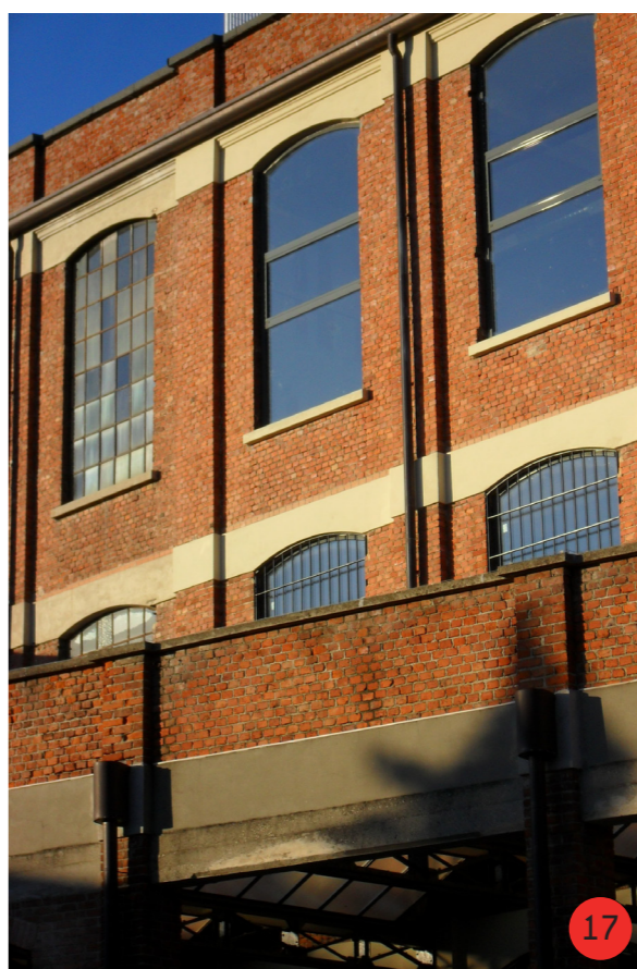
17. Particolare di confronto tra i seramenti nell'esistente, a sinistra, e seramenti successivi al recupero, a destra.