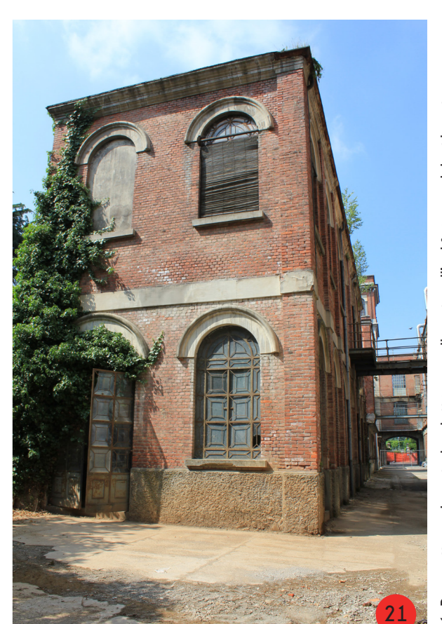
21. Prospetto sud centrale elettrica, collegato all'edificio nord. Inutilizzato, conserva al suo interno tutti gli impianti.