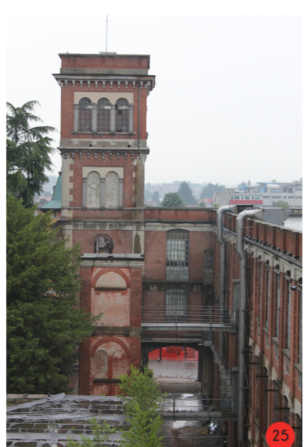
25. Torre nord e manico di collegamento all'edificio nord, ripresi dalla copertura dell'edificio sud. In basso a sinistra i depositi aggiunti nel 1970.