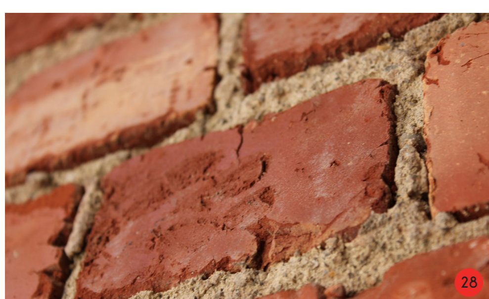
28. Particolare mattoni pieni, dimensioni 11,5 cm x 5,5 cm x 1,9 cm. I mattoni sono disposti tutti di testa a corsi regolari.