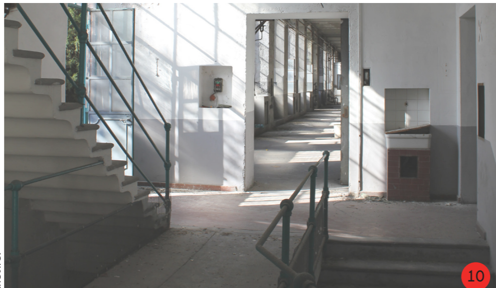
10. Ingresso piano primo, tra le due rampe della scala si realizza un "ponte" che permette di raggiungere lo stoccaggio.