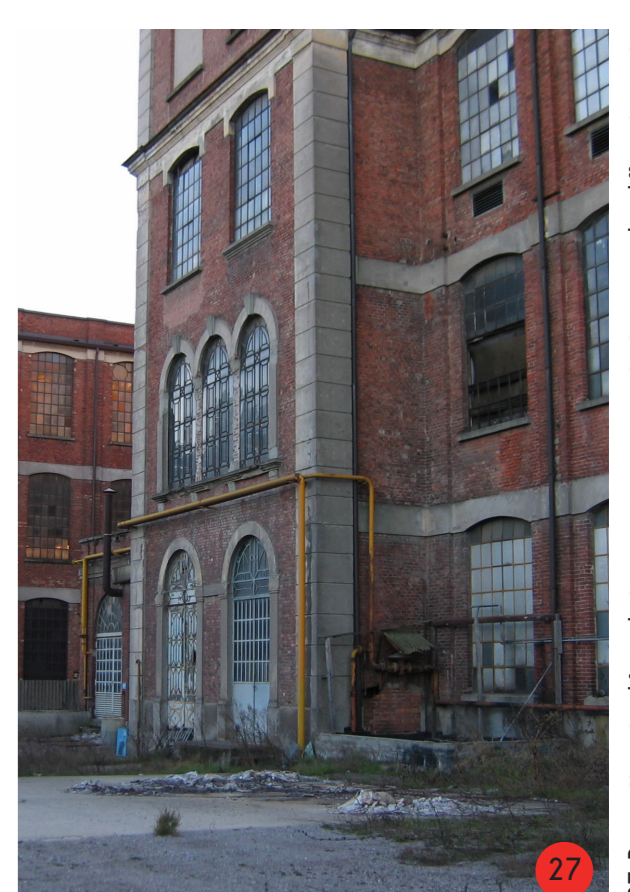
27. Prospetto est edificio di stoccaggio merci, costruito in epoche differenti, si sottolinea la variazione della tipologia e del ritmo delle aperture.