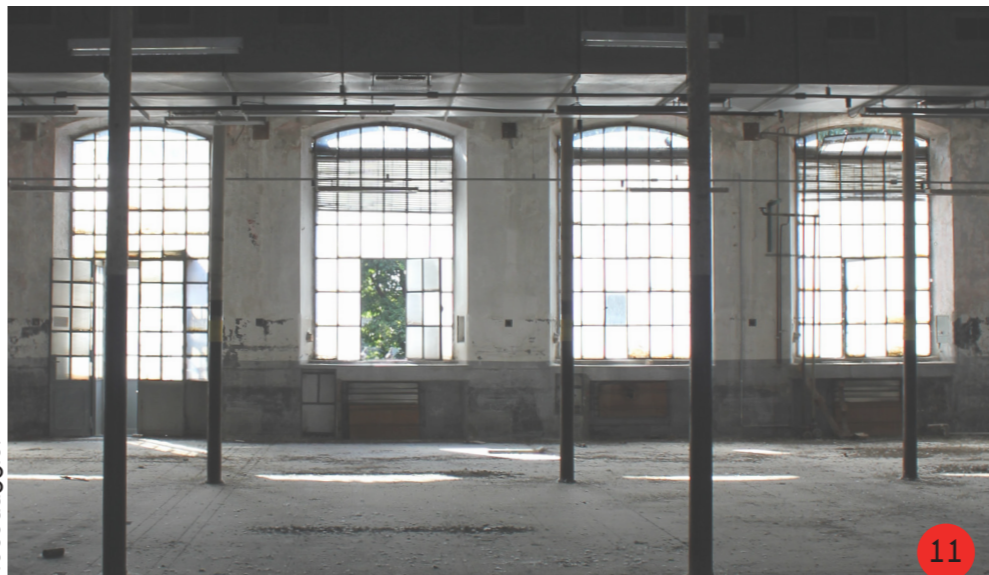
11. Vista prospetto interno tipo, dalla compata centrale si sviluppano altre due compatte, e infine la parete esterna.