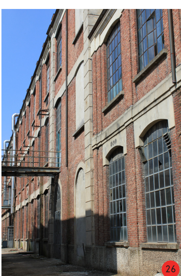
26. Porzione della facciata ovest. In primo piano il corpo contenete la ciminiera, in posizione centrale, l'edificio di stoccaggio.