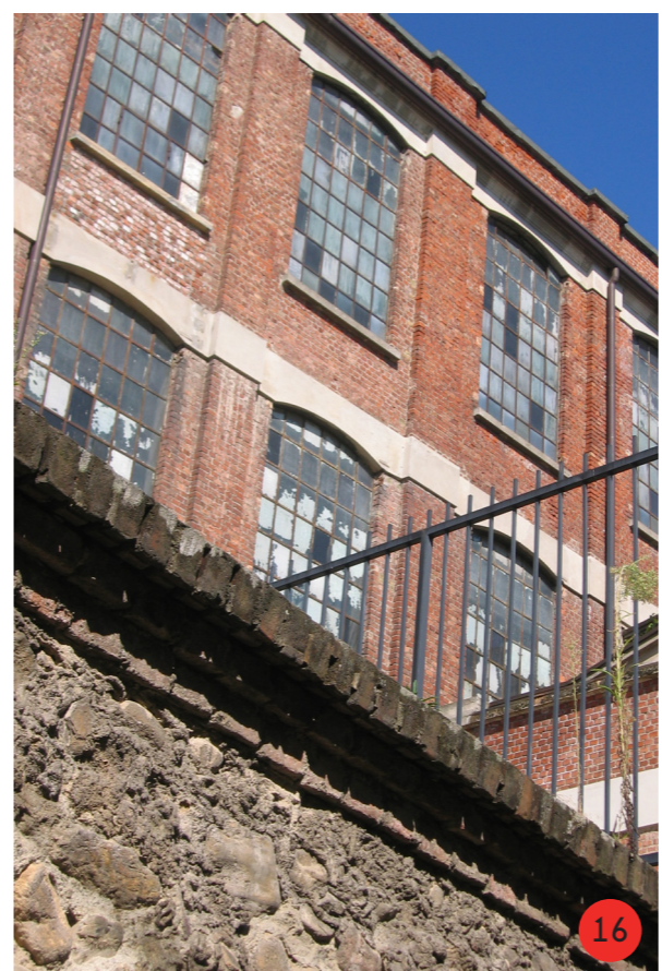
16. Particolare facciata sud, prima del recupero, si possono notare i seramenti originali, e in primo piano il muro di che portava alla galleria di via del Banco.