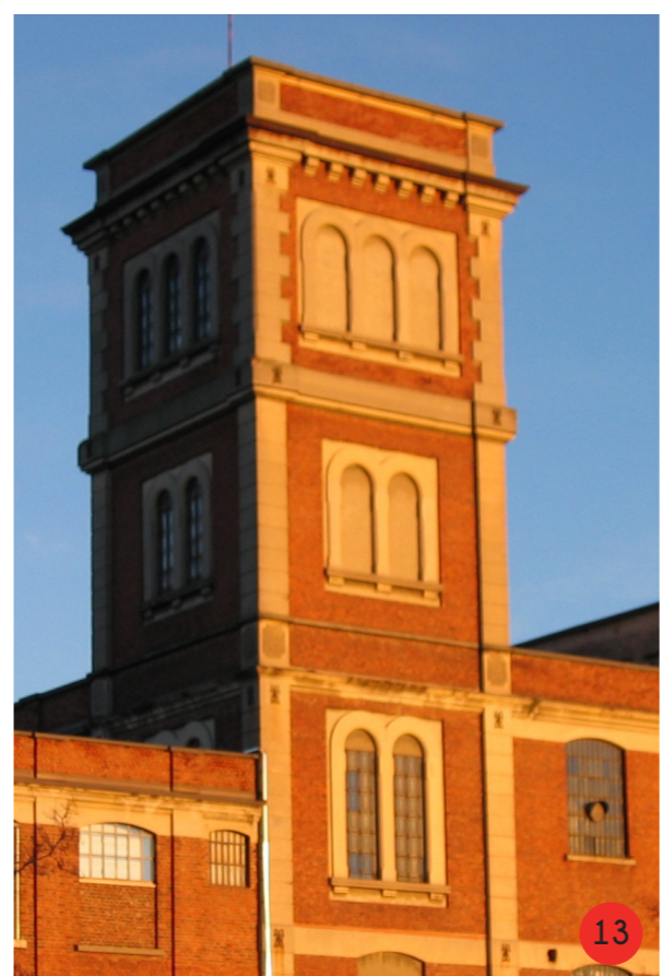
13. Particolare torre sud, a sinistra collegamento con edificio ad "L", a destra collegamento con edificio sud.