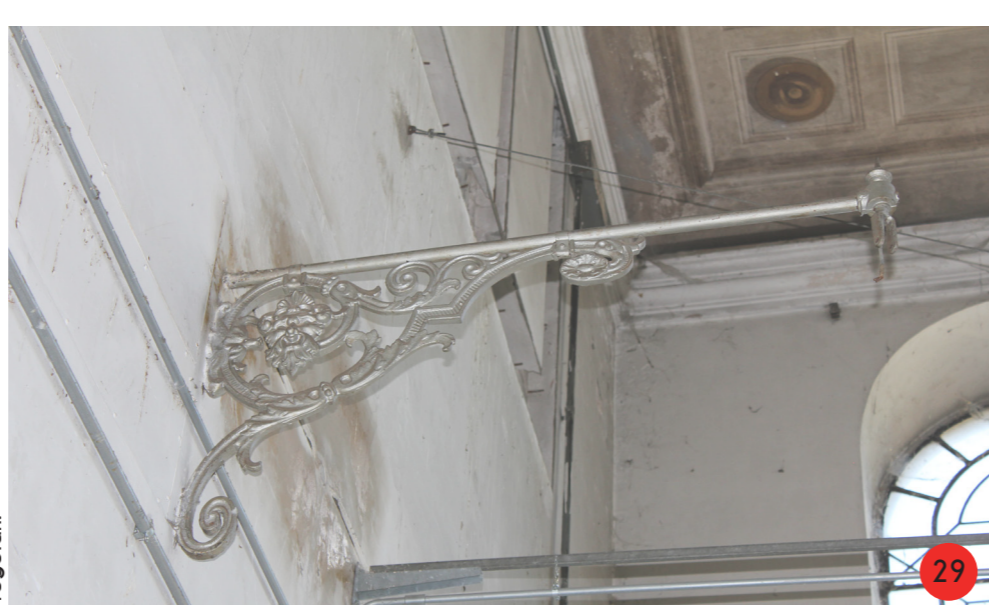
29. Sottile elemento di sostegno con originarie ancore esterne, nell'edificio di stoccaggio merci.