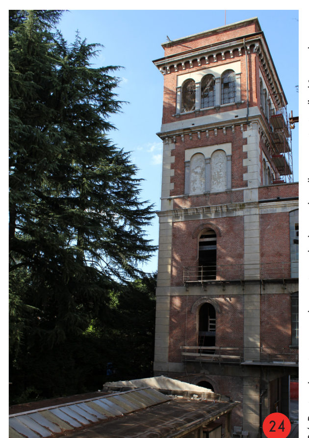
24. Particolare torre nord, il nostro i balconi di collegamento tra l'edificio e la torre, che rendevano accessibile il vano tecnico della esterna.