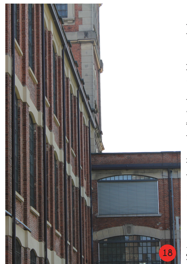
18. A sinistra prospetto nord, edificio sud, sulla fondo parte del corpo a "L", che ospita residenze, aggiunti all'originale prospetto piccoli balconi e un'ascensore.