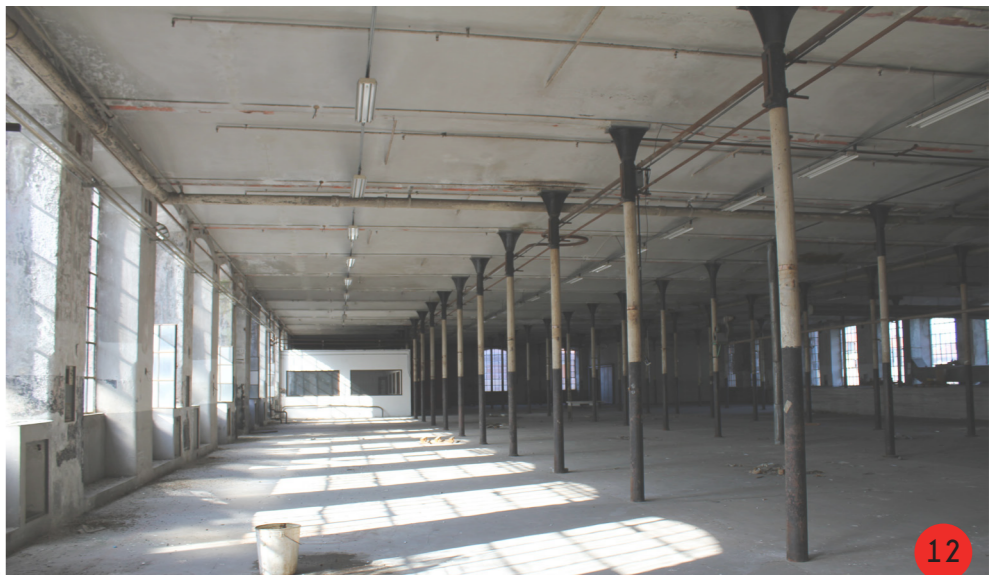
12. Piano secondo, in fondo a sinistra area uffici ricavata nel 1960 circa, realizzata con carotaggio.