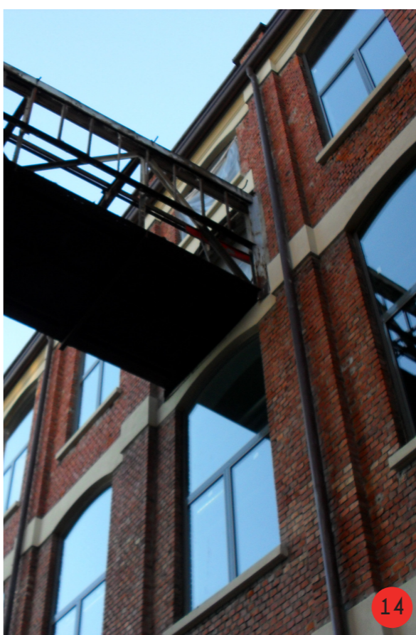
14. Particolare ponte di collegamento terzo piano edificio sud con terzo piano edificio di stoccaggio merci, recentemente demolito e non ricostruito.