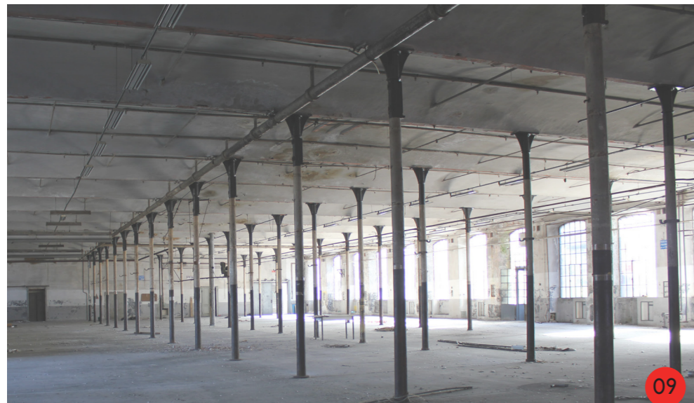
09. Piano terra, caratteristiche comuni a tutti gli edifici produttivi: colonne in ghisa, volte ribassate, ampie llumiere.