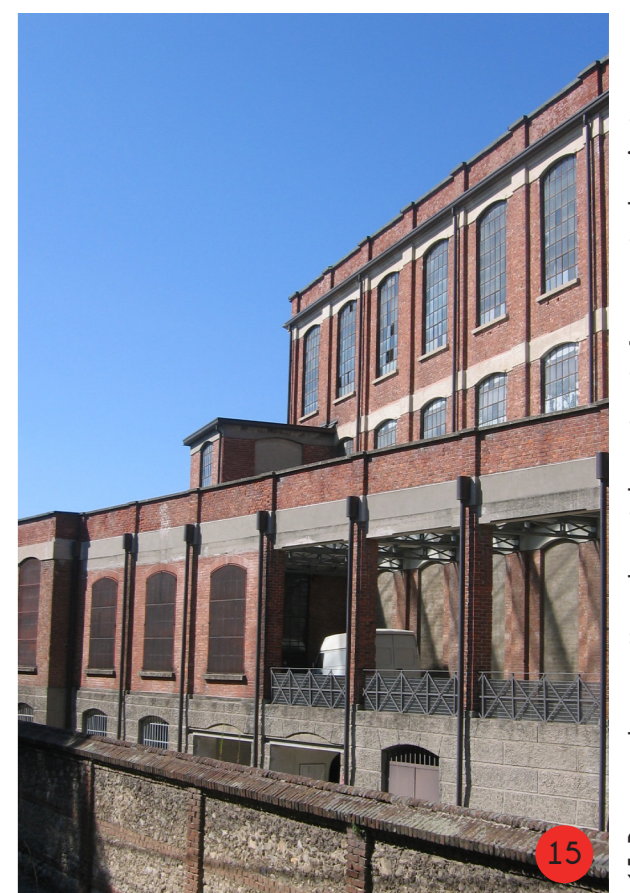
15. Particolare di prospetto sud ovest, il cui iterato è occupato da un'aula mensa per gli abitanti delle residenze dell'edificio a "L".