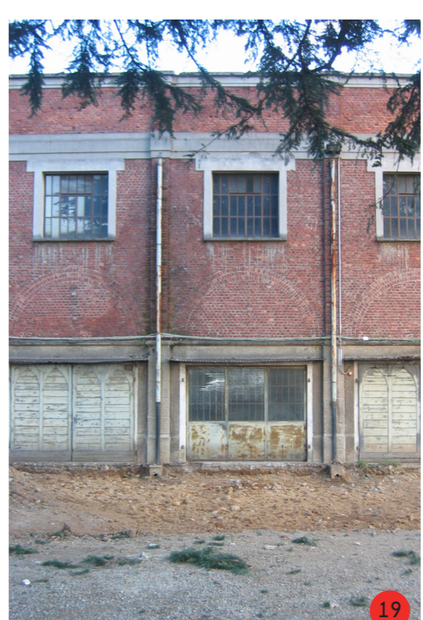
19. Prospetto ovest scale e finelli. In parte abbandonate da oltre quarant'anni, in seguito usato da parte di associazioni. Attualmente inutilizzato.