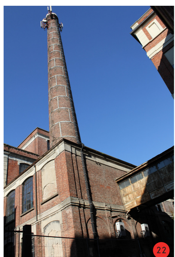
22. In basso edificio caldaie, a destra ponte di collegamento con edificio sud, recentemente restaurato, in alto la torre della ciminiera, inutilizzata dal 1974.