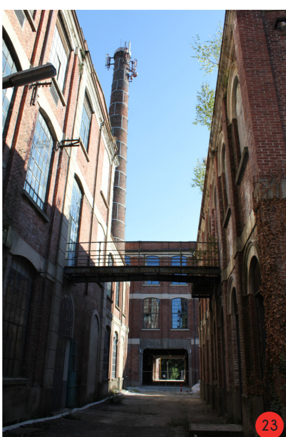
23. Vaso dell'asse nord sud che attraversa tutti gli edifici produttivi principali, ciclo ciclo caldo, al nostro i balconi di collegamento tra l'edificio e la torre, che rendevano accessibile il vano tecnico della esterna.