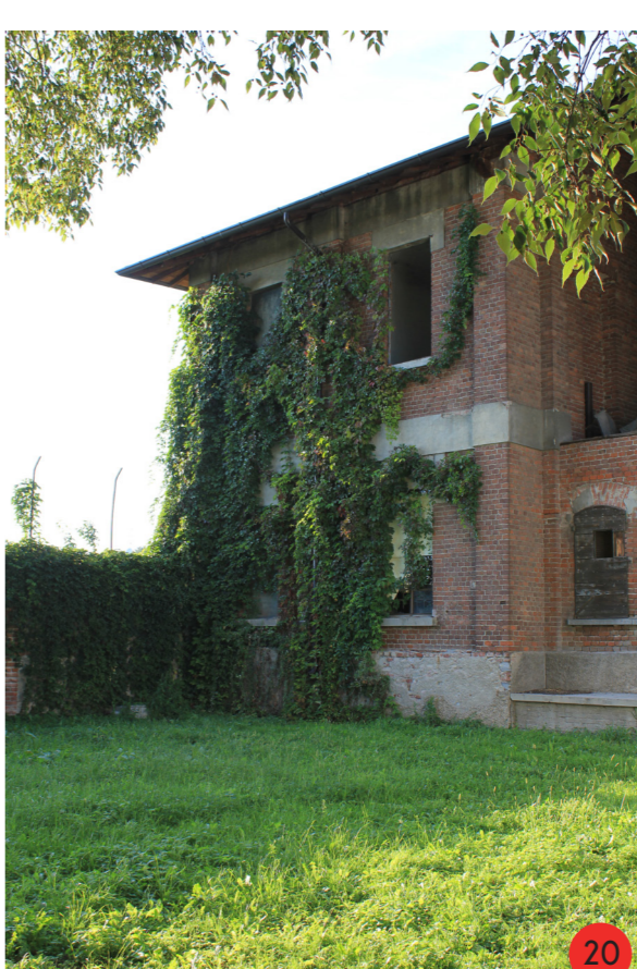
20. Prospetto sud stalle e finelli. In parte abbandonate da oltre quarant'anni, in parte utilizzato come deposito, è in condizioni di forte degrado.