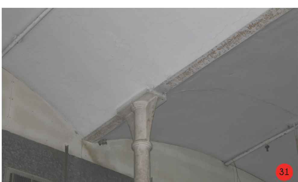
31. Capigliolo colonnare in ghisa, attacco a trave prefabbricata, riempimento volte ad arco ribassato.

Nota: le foto presenti in tutte le tavole sono state scattate a partire dall'anno 2006. Durante i rilievi fotografici per la mia tesi di laurea triennale erano ancora attive le aziende insediate negli edifici nord e sud. Attualmente l'edificio nord è inutilizzato, sono però in alto lavori di messa in sicurezza della torre nord, volti all'eliminazione della esterna. L'edificio sud è in parte recuperato, da COMO HE T e in parte abbandonato. Lo stallo merci è inutilizzato, le stalle sono usate in parte come magazzino dall'amministrazione comunale, e in parte abbandonate. Queste ultime versano in stato di forte degrado, il tetto originale è in parte crollato. Gli edifici produttivi più piccoli ad ovest, sono apparentemente disabitati, mentre l'edificio a "L", è abitato. L'abbriveratoio è stato recuperato, e fortemente modificato. Gli edifici risalenti al 1970 sono complessivamente in buone condizioni, risultano utilizzati dalle piccole attività artigiane presenti da diversi decenni.