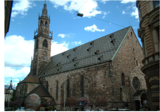
Duomo di Bolzano