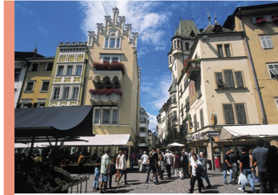
centro storico Bolzano