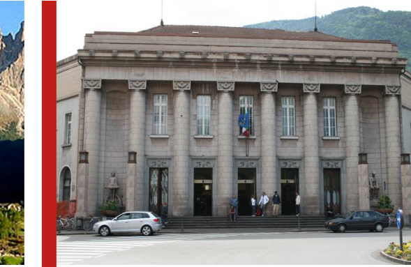
stazione ferroviaria Bolzano