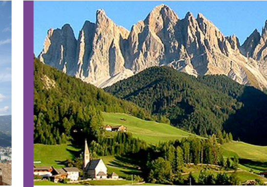
passeggiate attorno a Bolzano