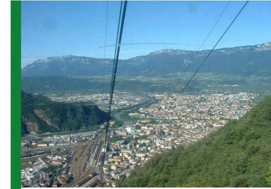
funivia di San Genesio