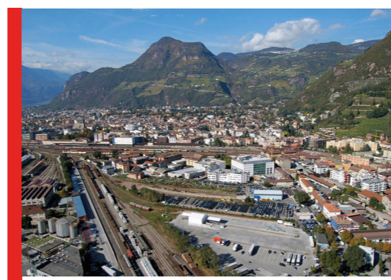
Manca di collegamenti con la città