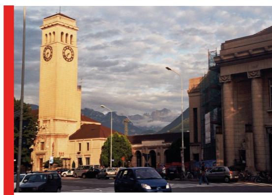
Piazza della stazione trafficata