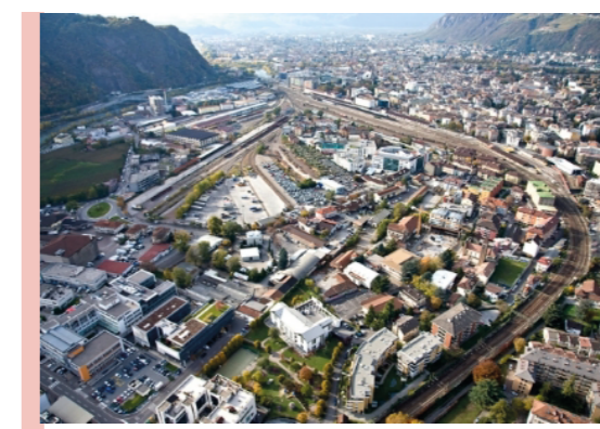
concentrazione monofunzionale produttiva