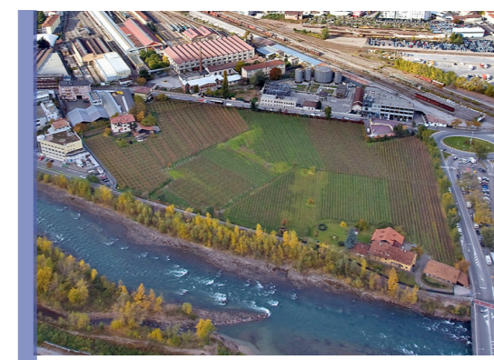
area a destinazione agricola