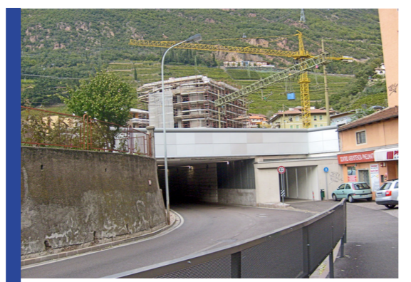
punto d'accesso all'area di progetto