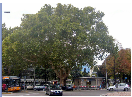
monumento naturale nella Piazza della Stazione