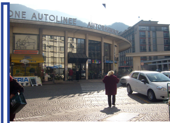
trasporto pubblico su gomma