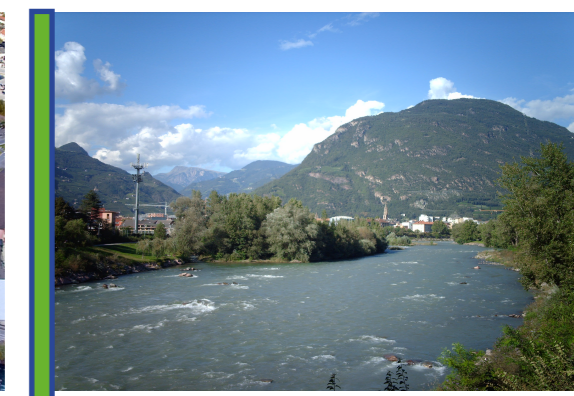
monte Virgolo storico