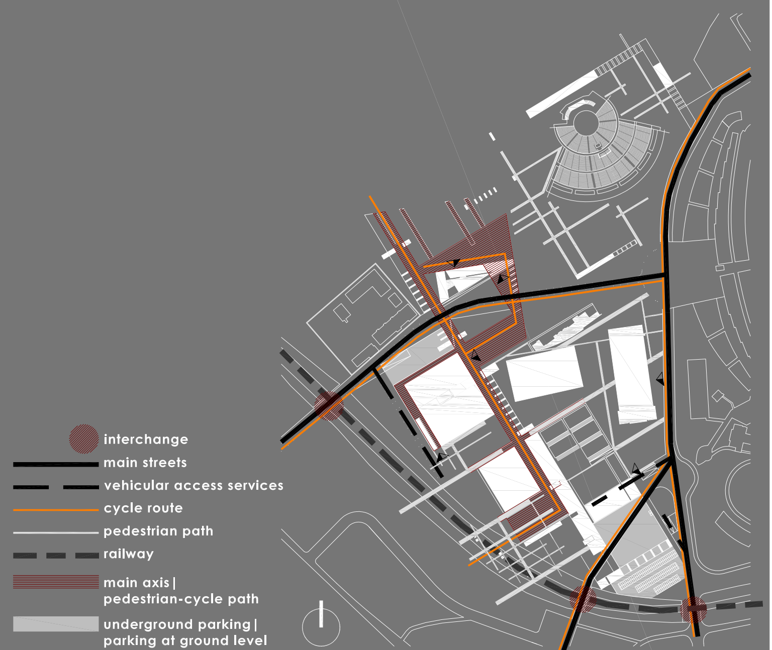
accessibilità | differenziazione dei percorsi