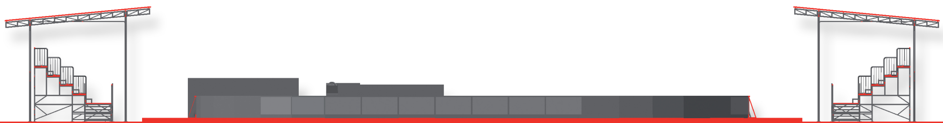
SEZIONE TRASVERSALE; SCALA 1:200