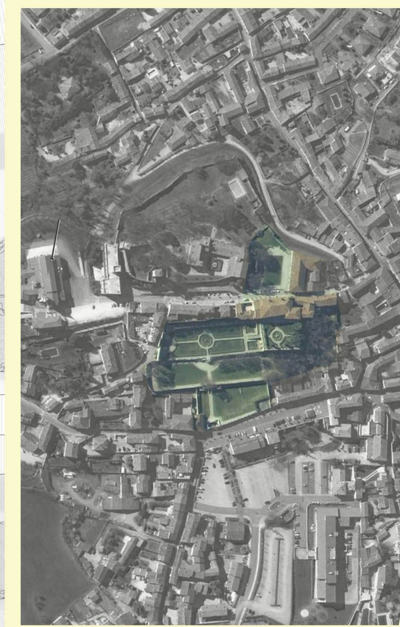
Ortofoto del centro storico di Volta Mantovana. Scala 1:5000