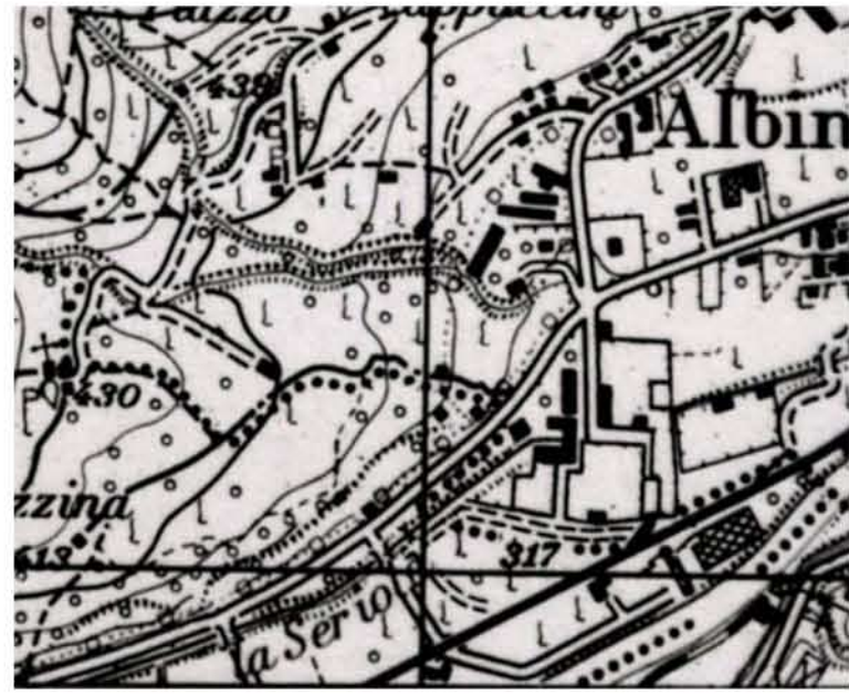
Carta d'Italia I.G.M. 1971 - 1:25000