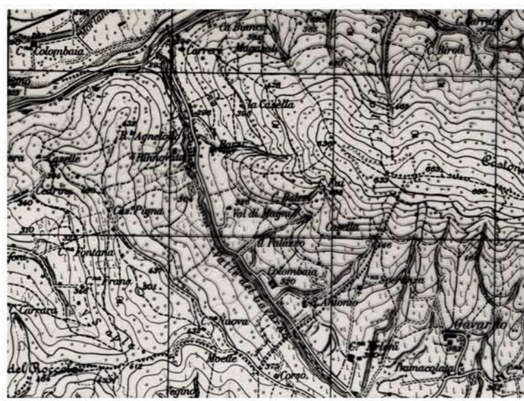
Carta d'Italia I.G.M. 1971 - 1:25000