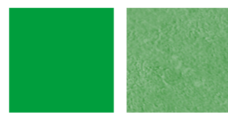
Cemento colorato in pasta