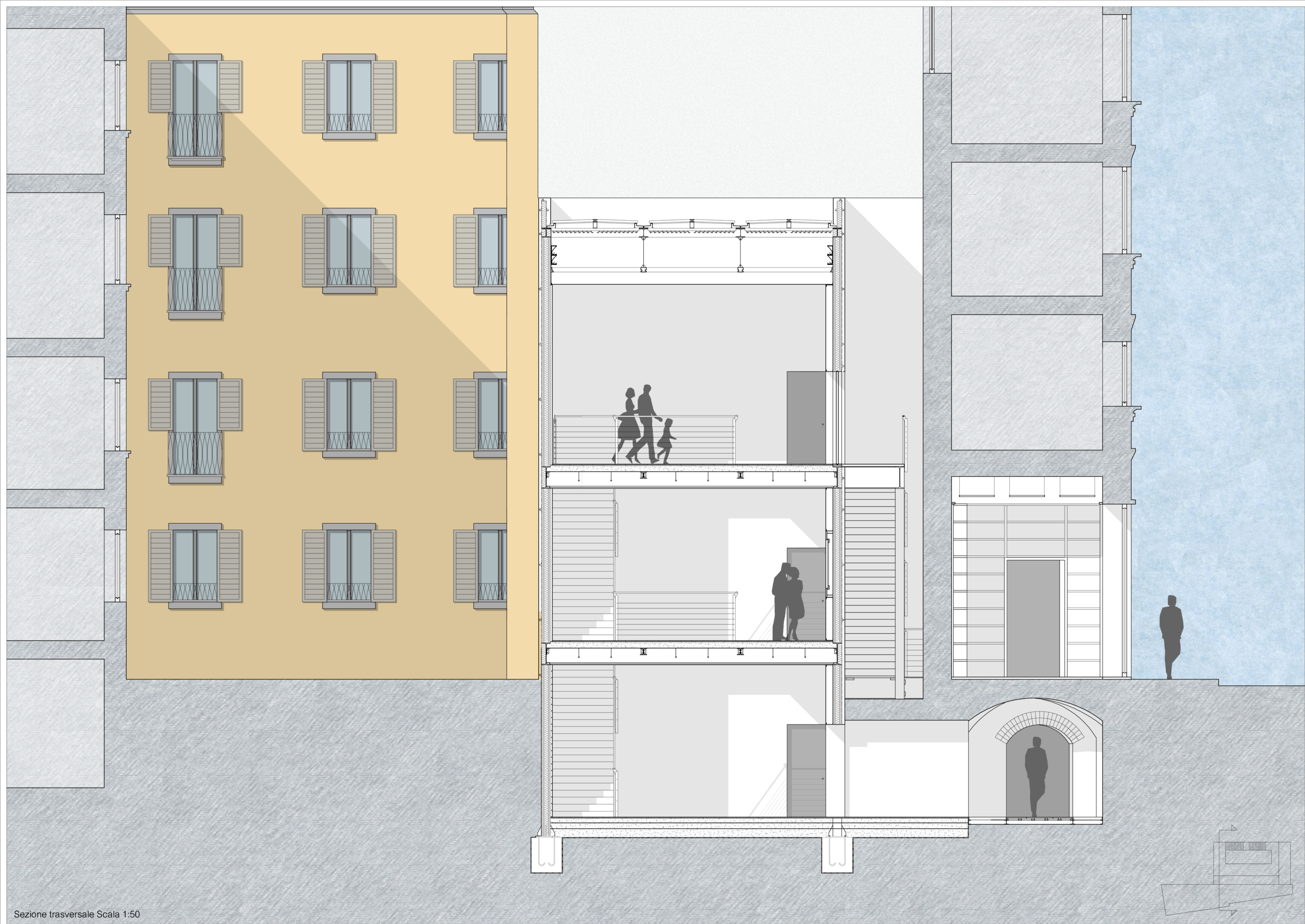
Sezione trasversale Scala 1:50