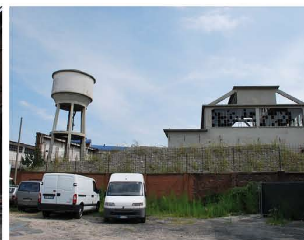
2. INGRESSO DAL PARCO LINEARE