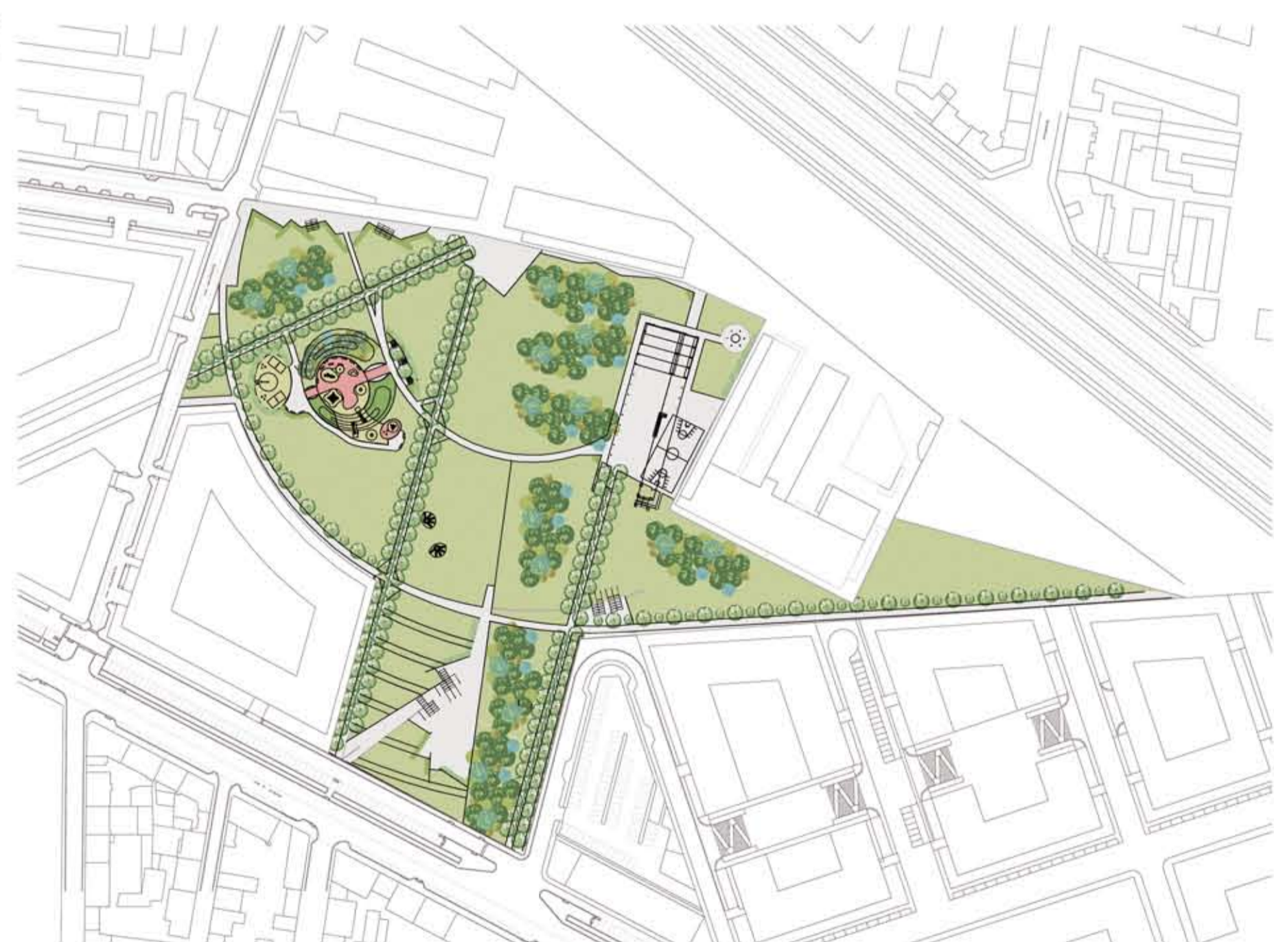
PROGETTO PROPOSTO DAL COMUNE DI TORINO maggio 2010