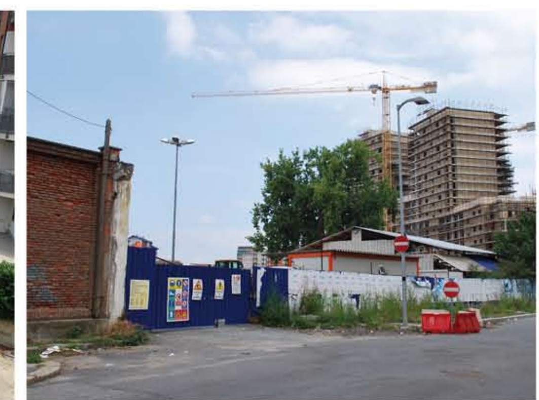
4. INGRESSO SUIO SULLA PIAZZA LINEARE