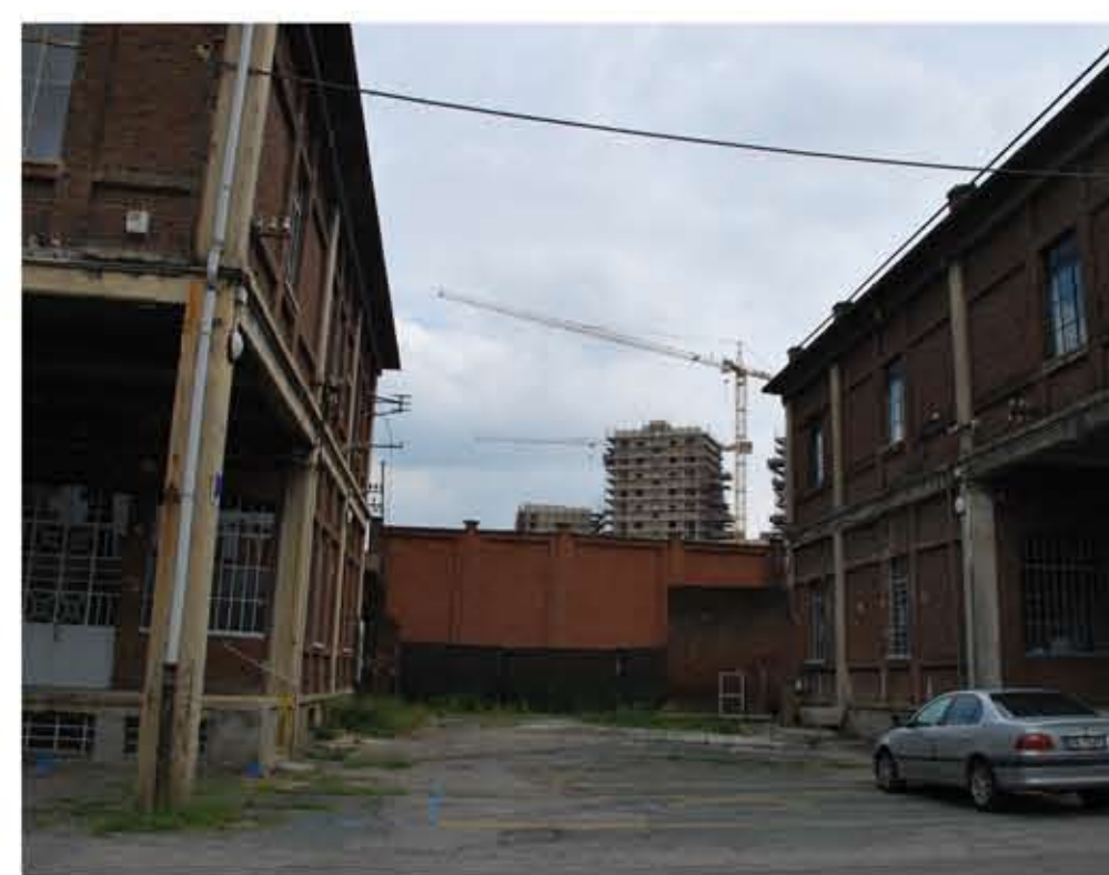
1. INGRESSO DAI DOCKS DORA

PUNTI FERMI - VINCOLI 70% della superficie a verde. TRACCIATO DEI TRE VIALI ALBERATI. SPECIE ARBOREE ATTE AL RECUPERO AMBIENTALE. Tracciato e disegno aree pavimentate a funzioni specializzate. PRESENZA DI COPERTURE DI OMBREGGIATURA. Zone del parco con funzioni già definite nel progetto della Comune: 1. GIOCO BIMBI 2. ZONA FITNESS 3. PIAZZA DELLA SOCIALITÀ 4. piazza lineare della ristorazione 5. AREA EX INDUSTRIALE "PORCHEDDU".