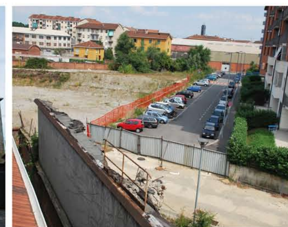
3. INGRESSO EST DALLE NUOVE RESIDENZE