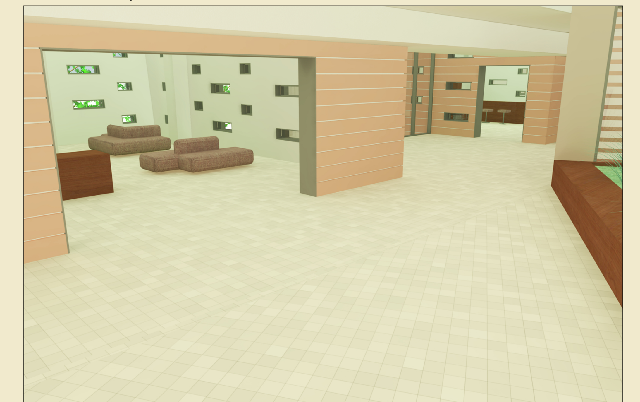
Atrio piano 1°