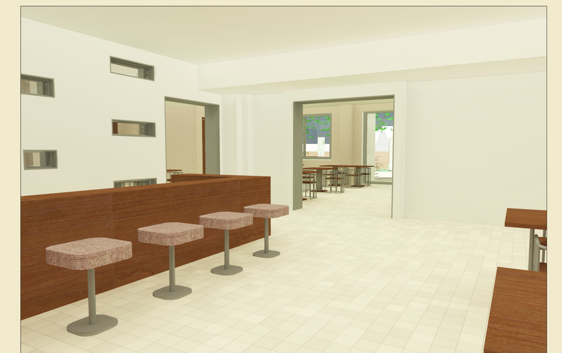
Bar / ristorante