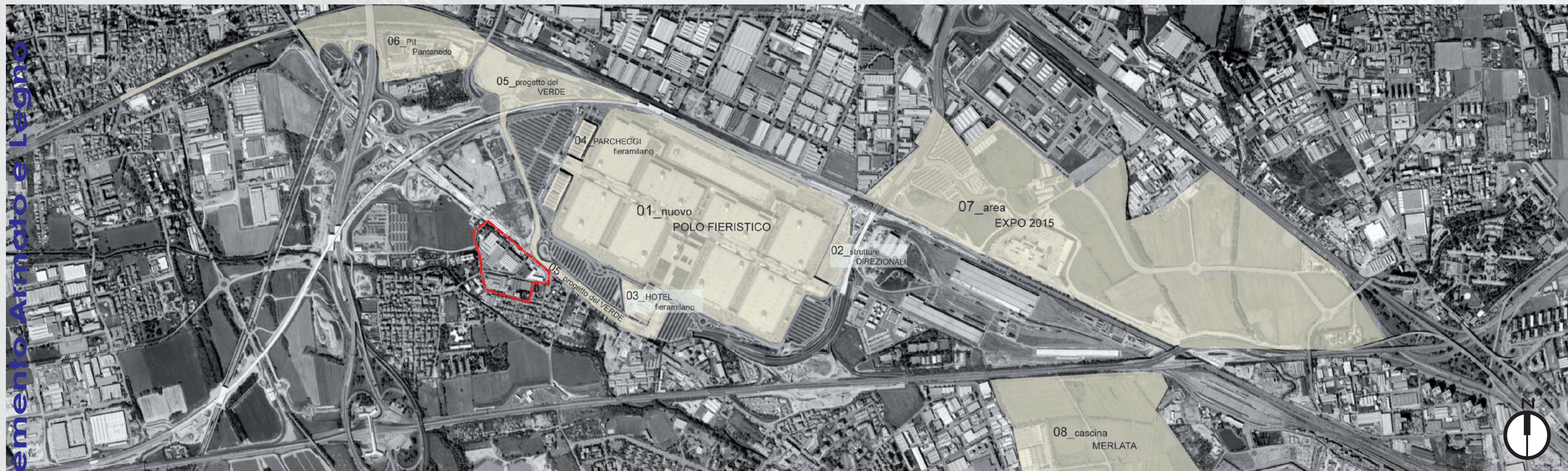
01_nuovo POLO FIERISTICO Progetto_Massimiliano Fuksas Realizzato, 2005