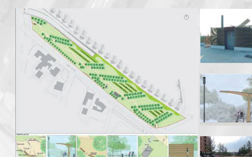
06_Pil Pantanedo Progetto_Archa In programma