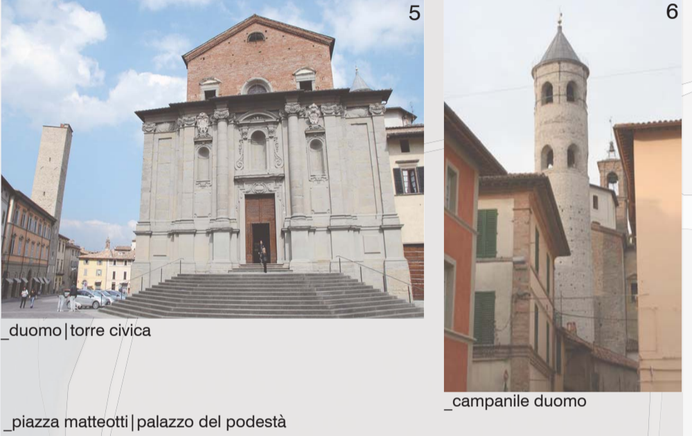
L'ANELLO CENTRALE DI VIA DEL POPOLO