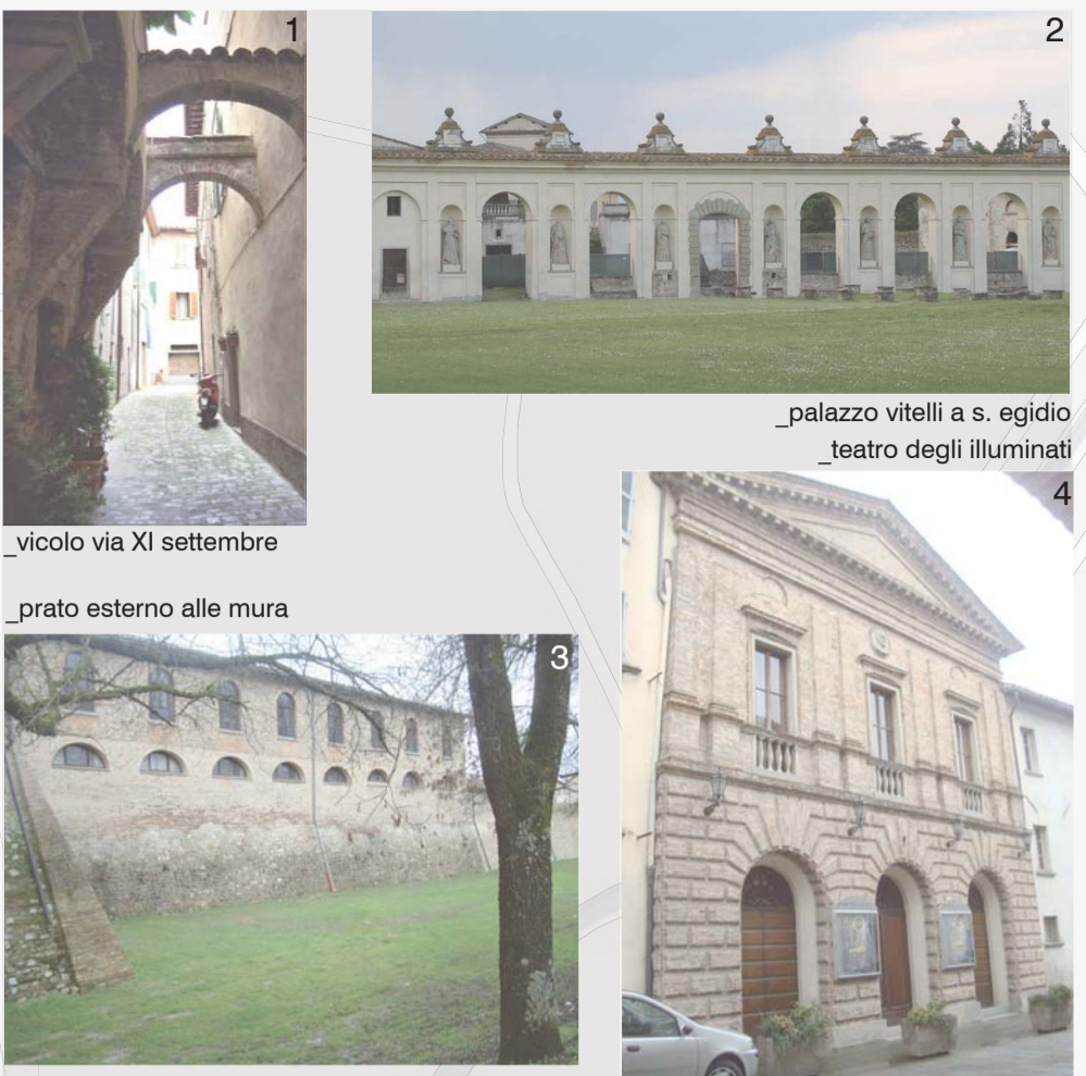
IL SETTORE SETTENTRIONALE