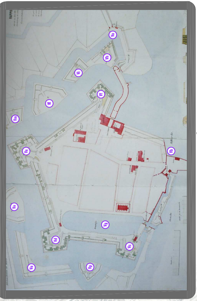
1866 Planta di Cittadella . Disegno a penna, inchiostro e acquerello (O.K.W., Kartensammlung, Ausland II, a. 2, Mantua, n.2)