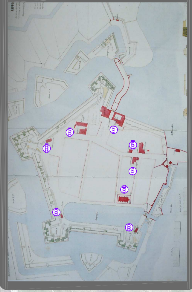
1866 Pianta di Cittadella Disegno a penna, inchiostro e acquerello (O.K.W., Kartensammlung, Ausland II, α. 2, Mantua, n.2)