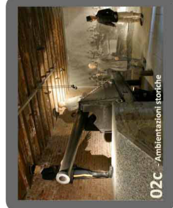
02c - Ambientazioni storiche