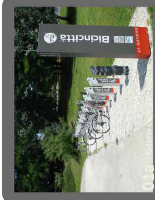
01a - Noleggio biciclette