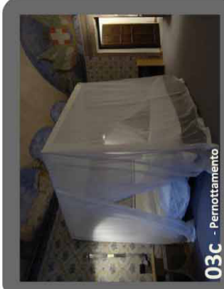
03c - Pernottamento