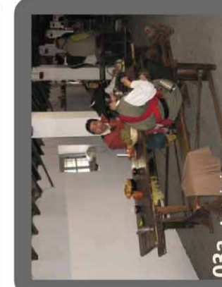
03a - Area picnic