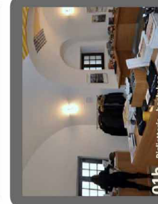
01b - Biglietteria - bookshop