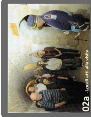
02a - Locali atti alla visita