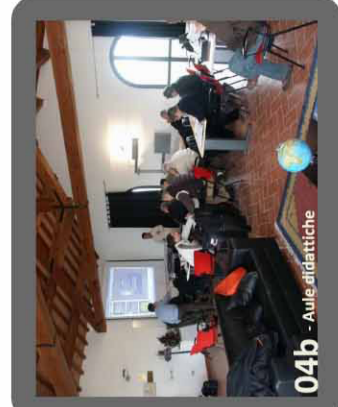
04b - Aula didattica