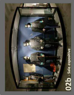
02b - Sale espositive