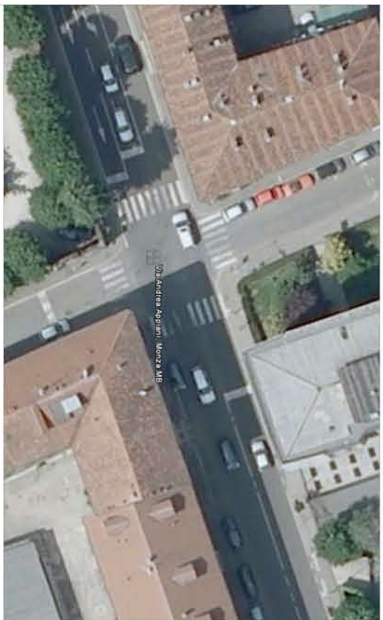
1. INCROCIO VIA DEI MILLE / VIA APPIANI