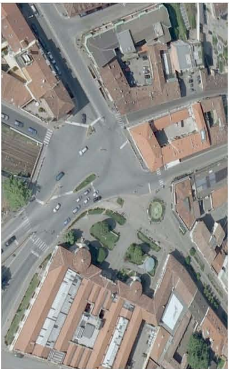
10. INCROCIO LARGO MAZZINI