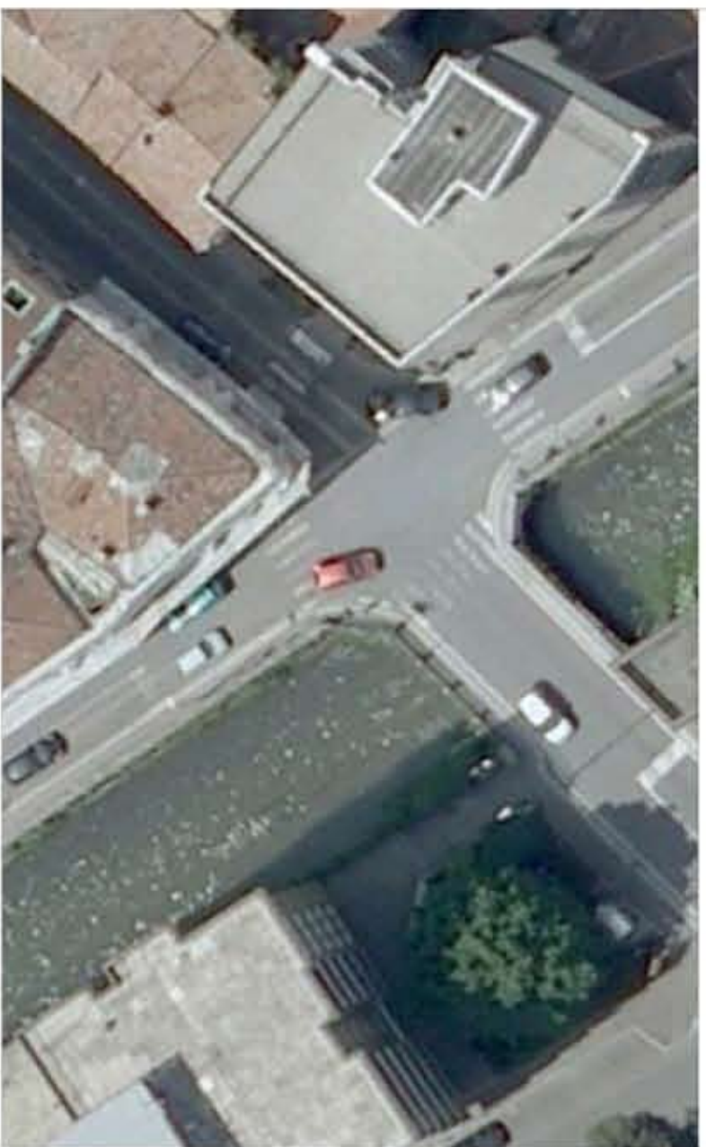
12. INCROCIO VIA LECCO / VIA ALIPRANDI