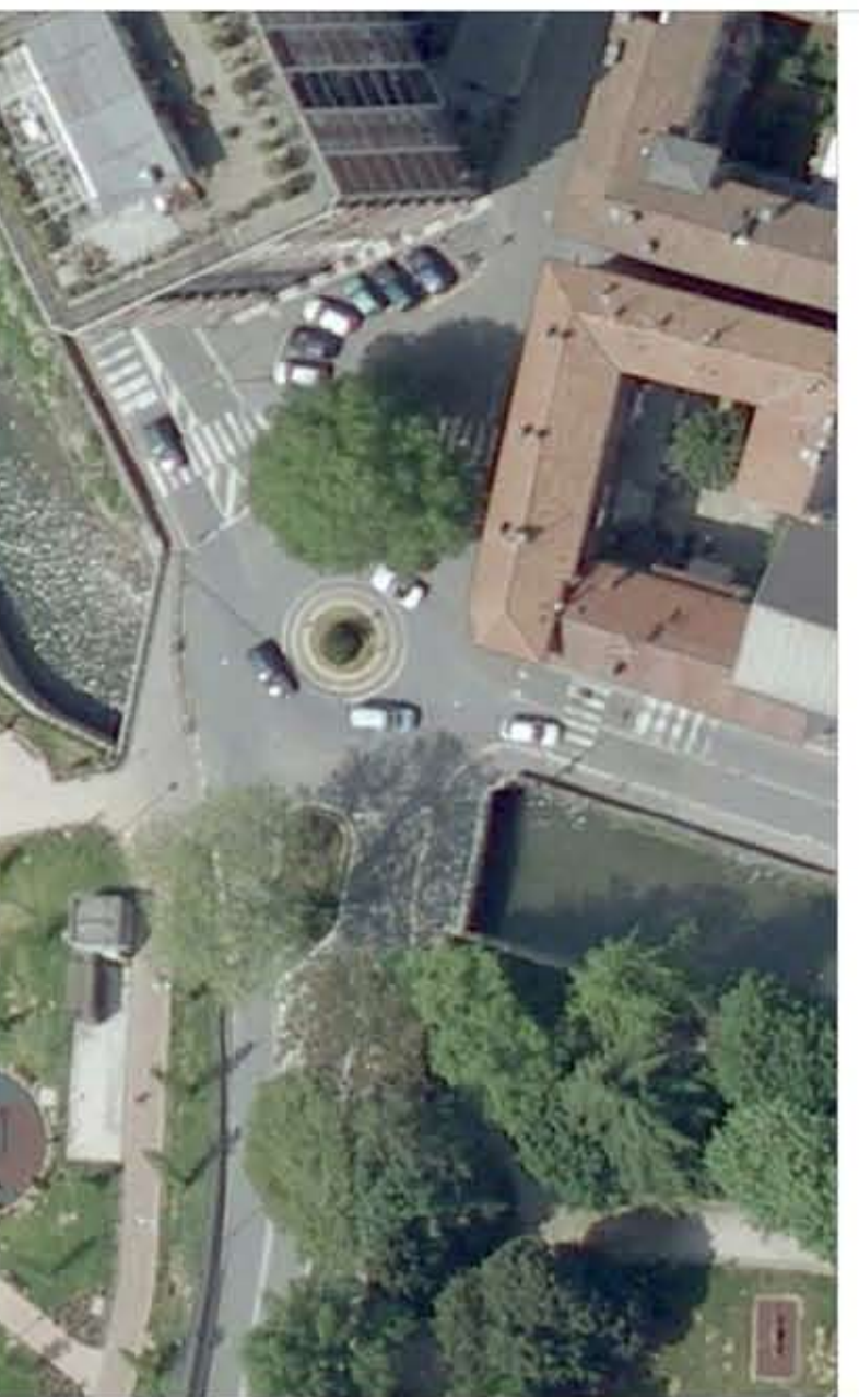
11. INCROCIO VIA VISCONTI / VIA LODI