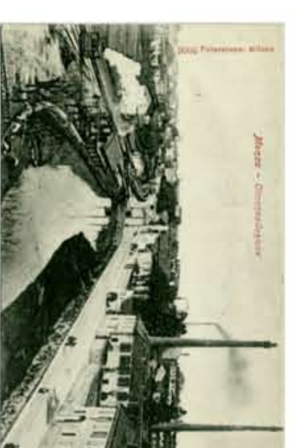
Ponte de' gradi