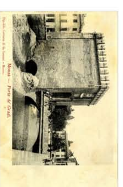
Porta de' gradi