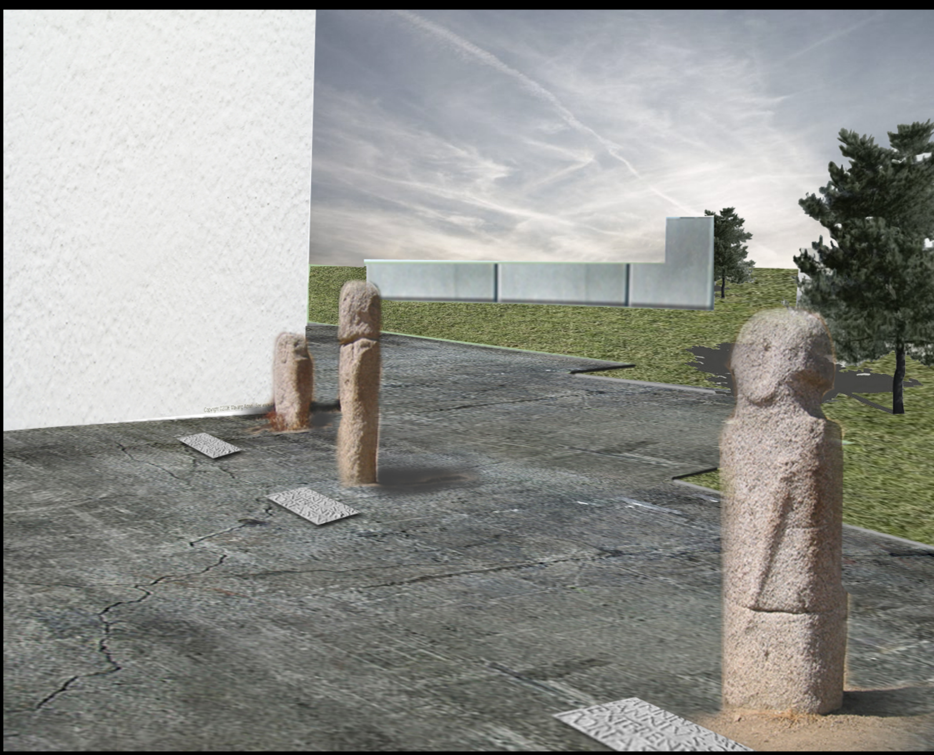
1-STATUE STELE ANTROPOMORFE