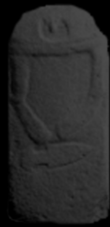
PRE - ETÀ DEL BRONZO