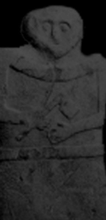
ETÀ BRONZO E FERRO