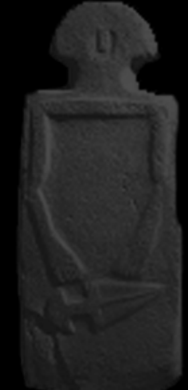
FINE ETÀ DEL BRONZO