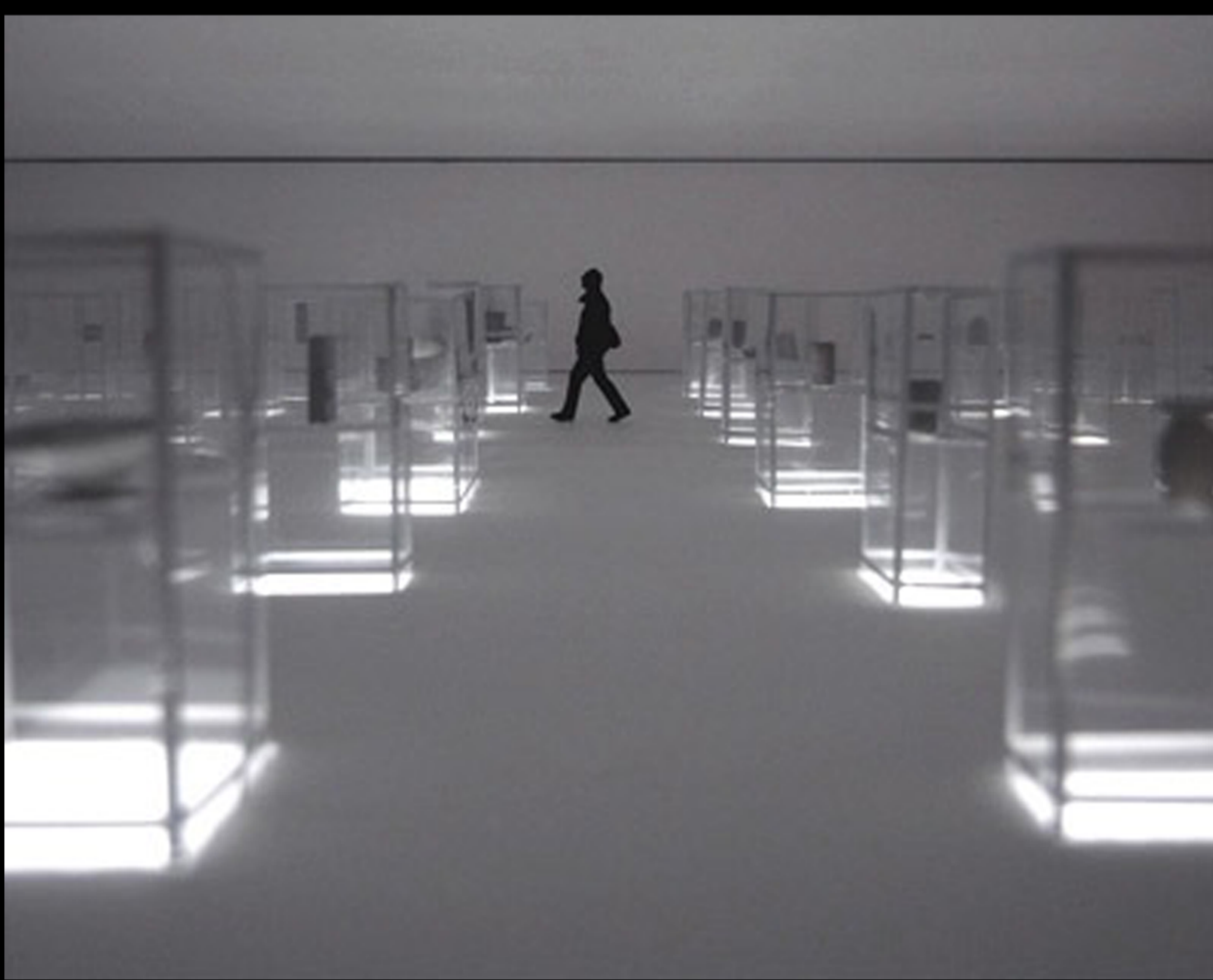
5- TECHE CONTENENTI PICCOLI MANUFATTI ARTIGIANALI.