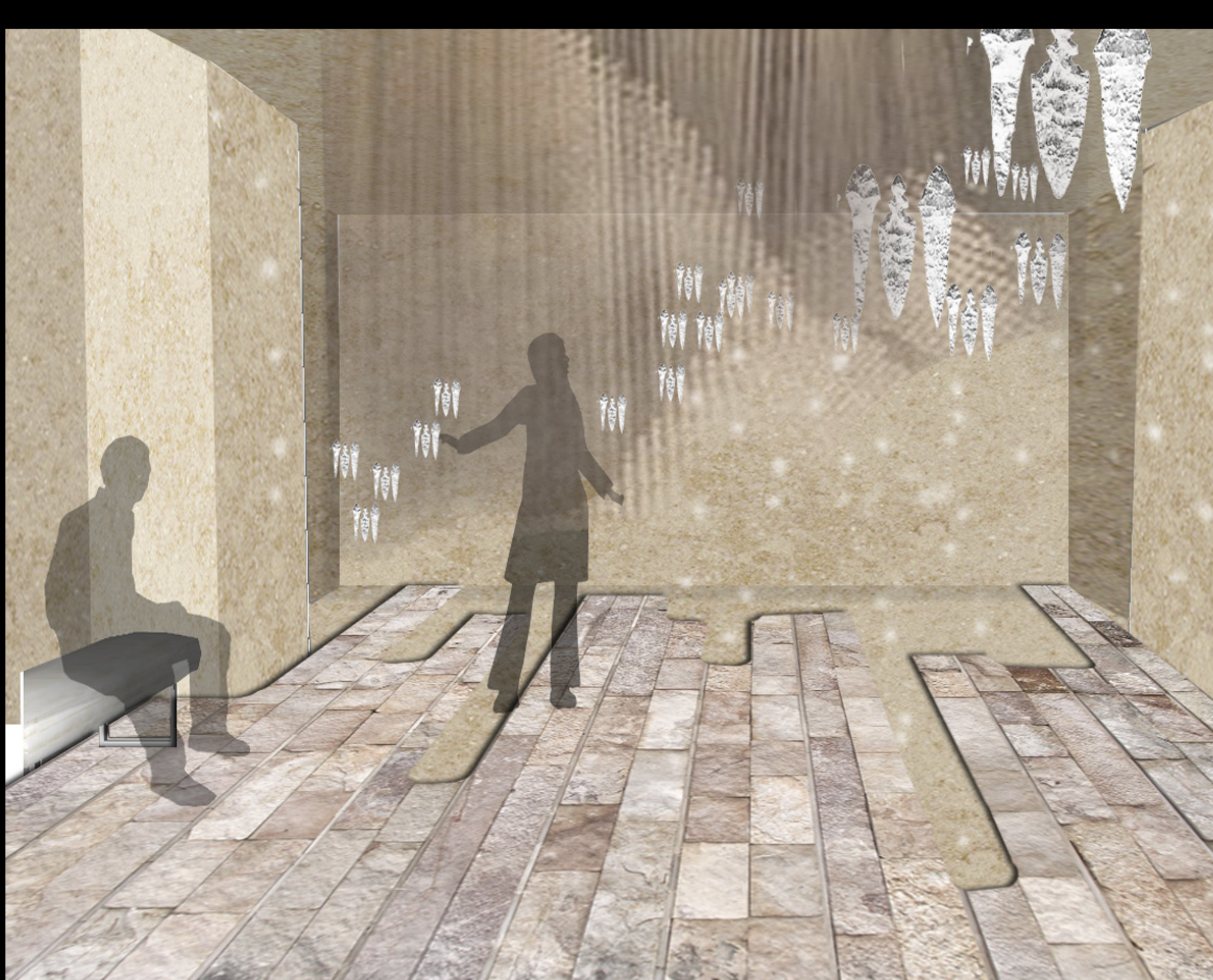
6- L'ICONA DELL' ETÀ DEL BRONZO E FERRO, GLI STRUMENTI DI CACCIA. DISPOSIZIONE ARTISTICA.