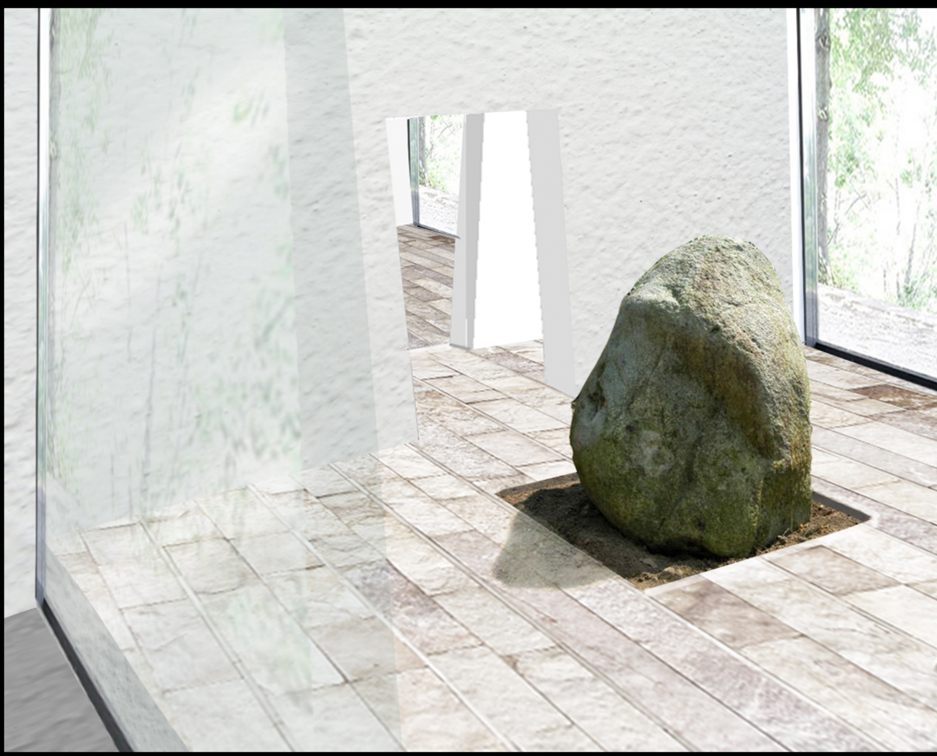
2-MASSI DI BORNO, ISTORIATI CON INCISIONI RUPESTRI.