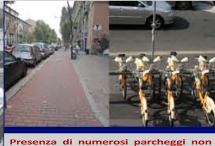
Presenza di numerosi parcheggi non regolamentati