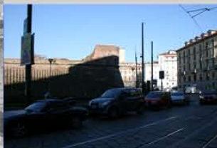
Predominanza di flussi automobilistici su quelli pedonali