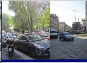
Assenza di connessione tra le diverse aree