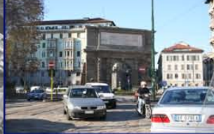
Elementi storici non valorizzati