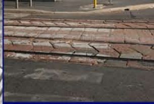
Assenza di un percorso ciclabile