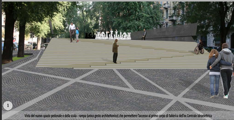
Vista del nuovo spazio pedonale e della scala - rampa (unico gesto architettonico) che permetterà l'accesso al primo corpo di fabbrica dell'ex Centrale Idroelettrica