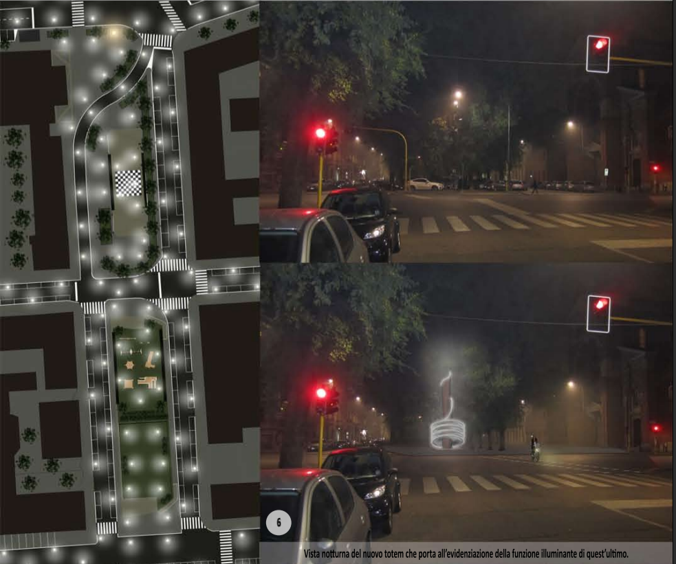
Vista notturna del nuovo totem che porta all'evidenziazione della funzione illuminante di quest'ultimo.