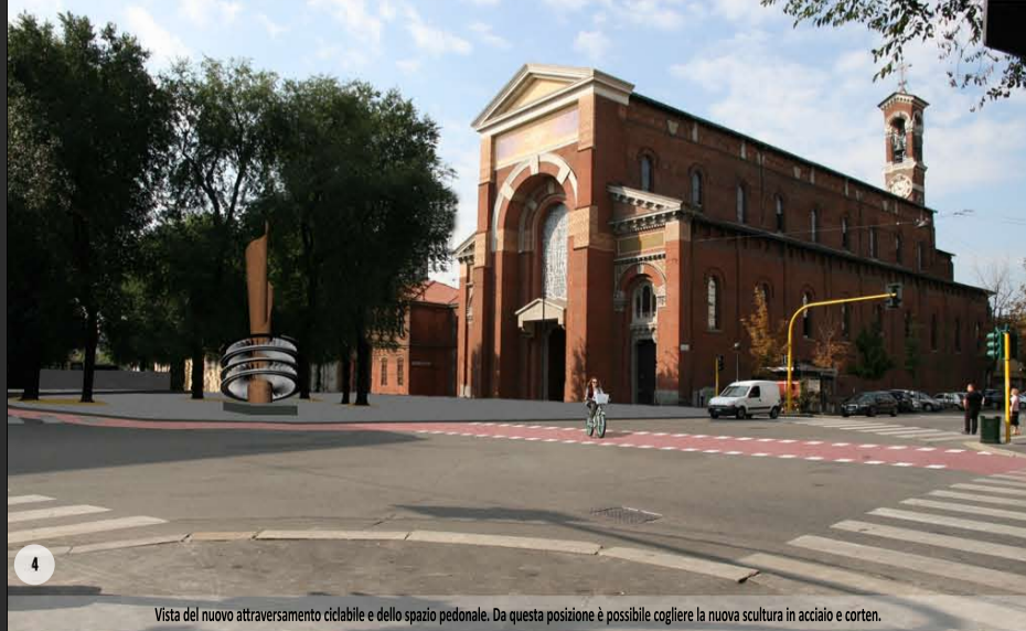
Vista del nuovo attraversamento ciclabile e dello spazio pedonale. Da questa posizione è possibile cogliere la nuova scultura in acciaio e corten.