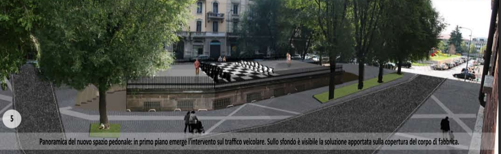
Panoramica del nuovo spazio pedonale: in primo piano emerge l'intervento sul traffico veicolare. Sullo sfondo è visibile la soluzione apportata sulla copertura del corpo di fabbrica.