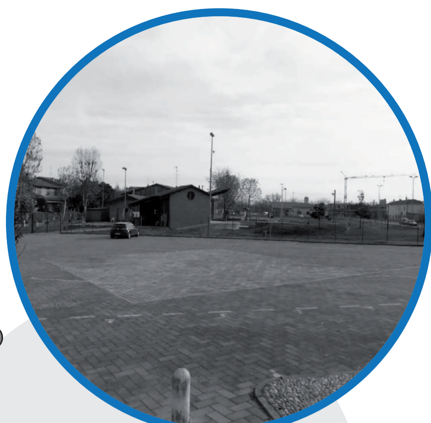
PIAZZA CADUTI DI NASSIRIYA