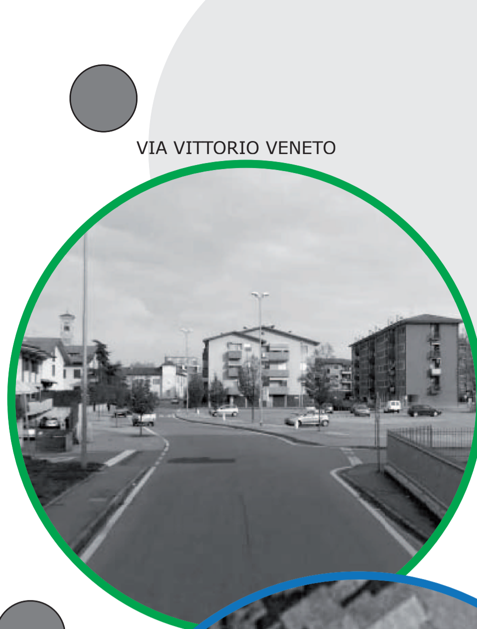
VIA VITTORIO VENETO