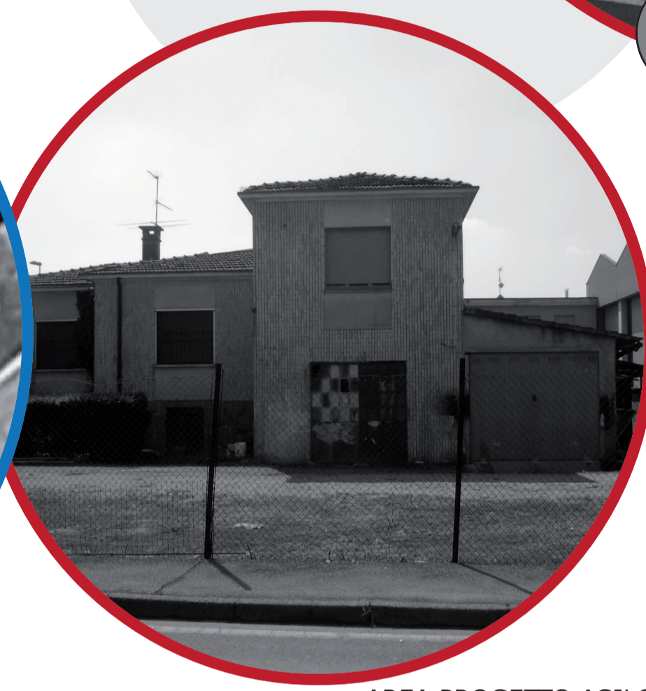
AREA PROGETTO ASILO NIDO