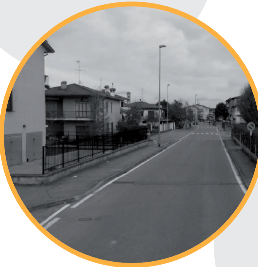
VIA LUIGI CHIESA