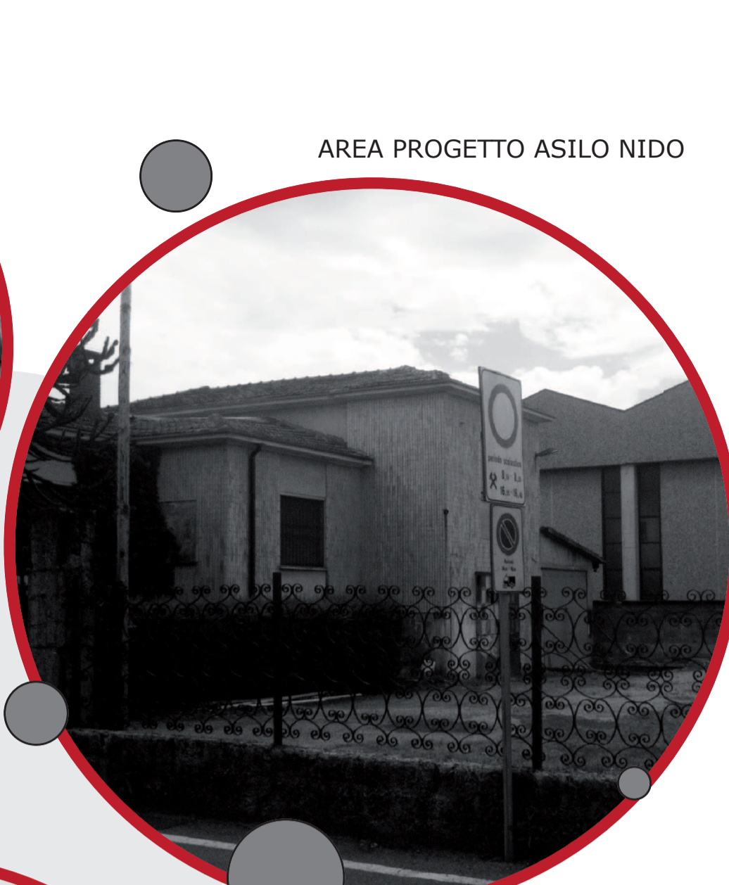
AREA PROGETTO ASILO NIDO