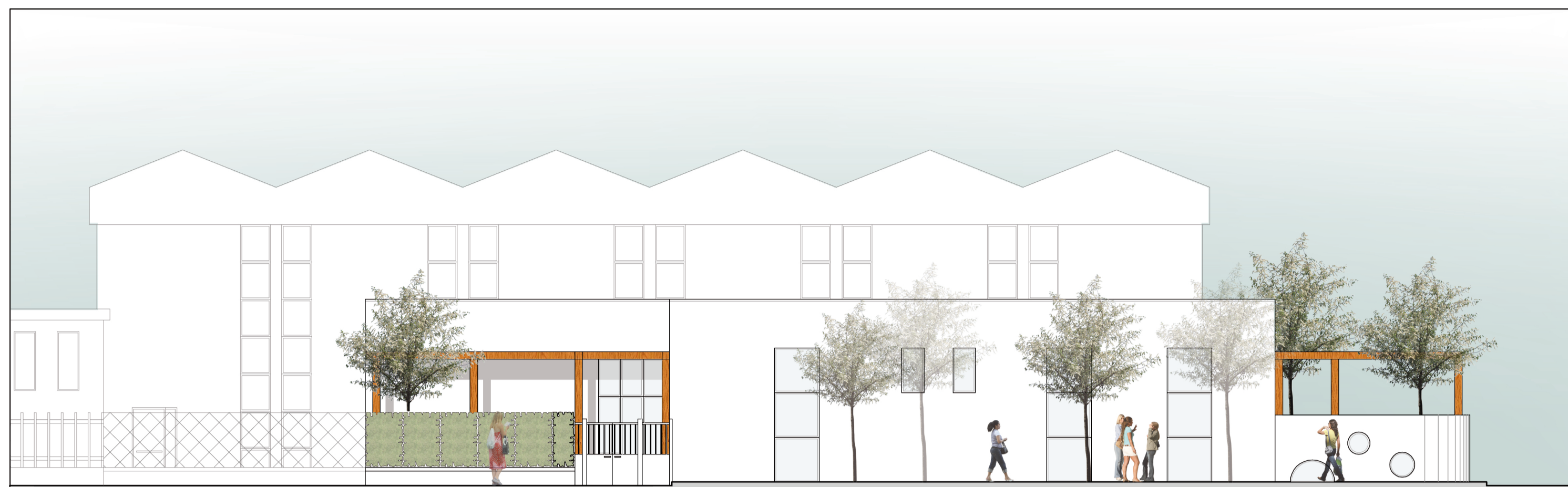
PROSPETTO EST_VIA ADA NEGRI