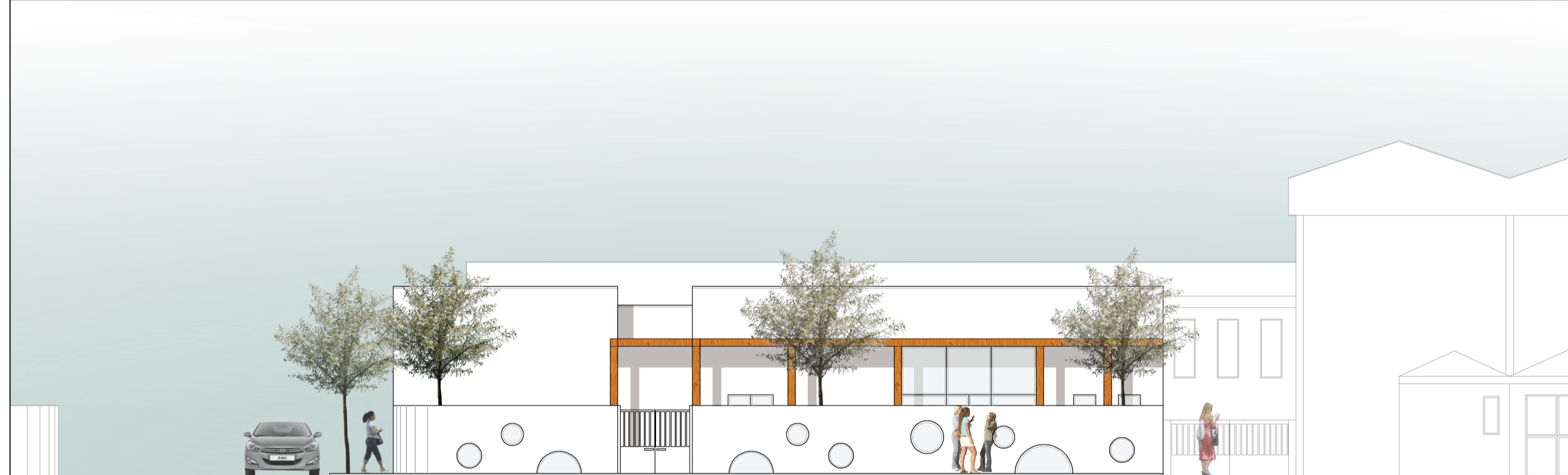
PROSPETTO NORD_VIA LUIGI CHIESA