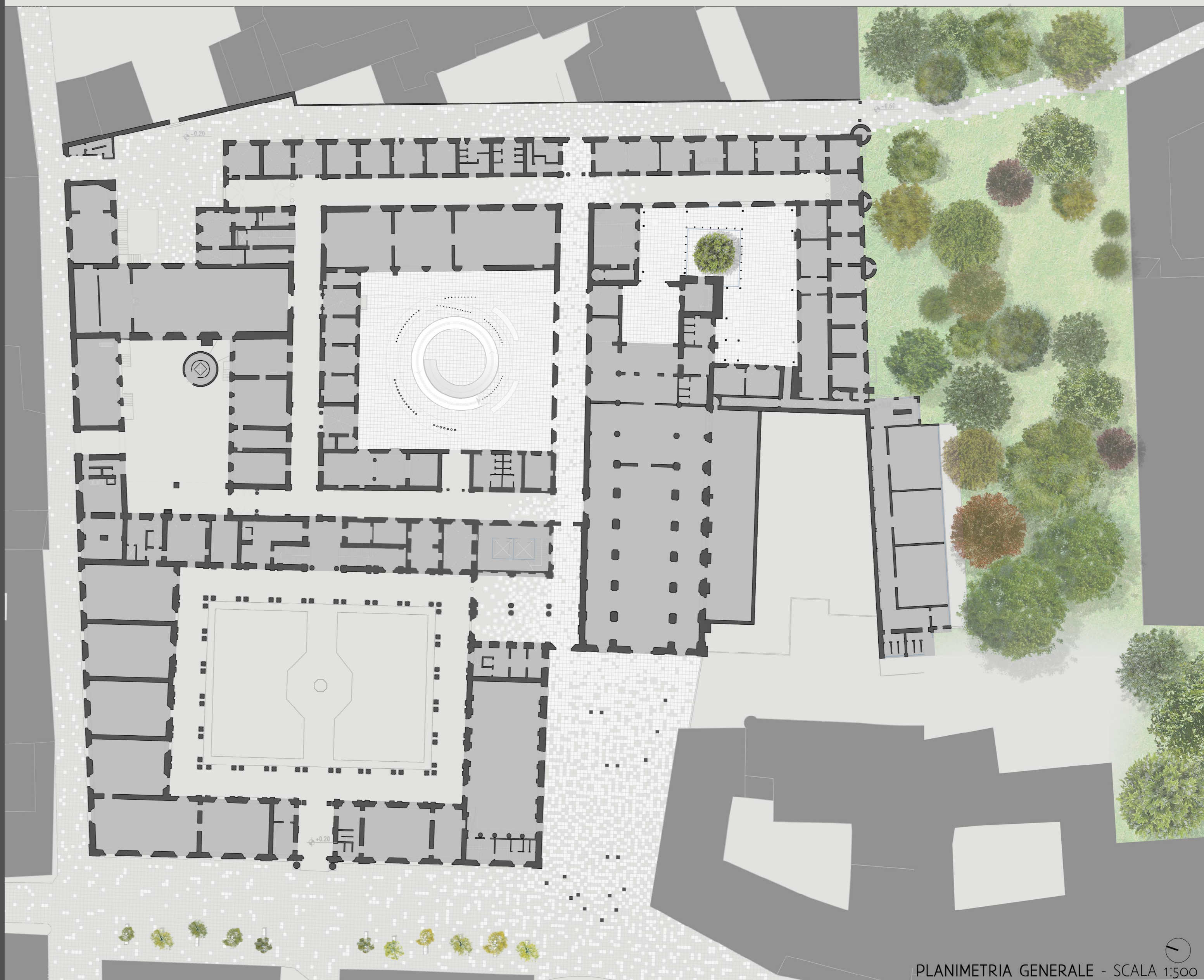
PLANIMETRIA GENERALE - SCALA 1:500