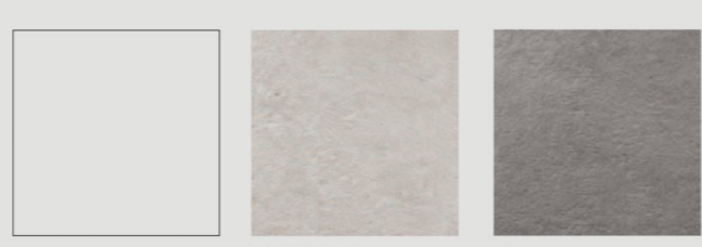
300x300, 30,6x30,6 22°/42° 2040 Zero Grey Square 2070 Zero Grey Square