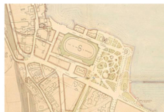
Planimetria nucleo urbano 1937