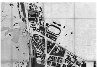
Variante di piano regolatore generale 1988