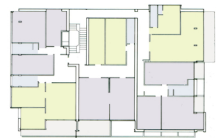
Pianta piano Tipo