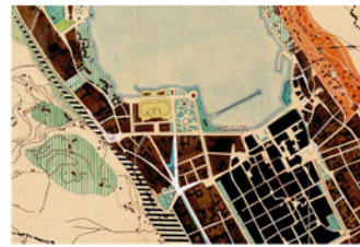
Estratto di piano regolatore di massima edilizio e di ampliamento 1937