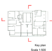
Key plan Scala 1:500