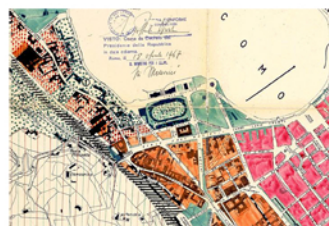
Estratto di piano regolatore urbanistico generale 1967