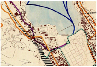
Trasporto urbano ed extraurbano 1937