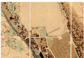
Tavola di zonizzazione 1937