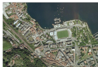
Immagine satellitare 2011