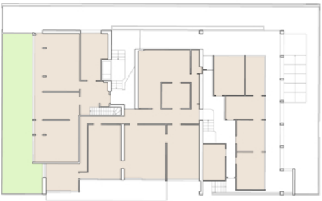
Pianta piano terra