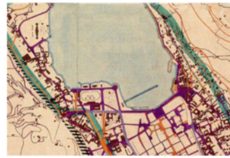
Rete viaria 1937