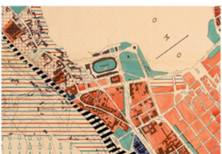
Variante alla zonizzazione del piano regolatore urbanistico generale 1952