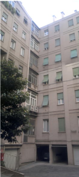
Angolo sud ovest della corte interna