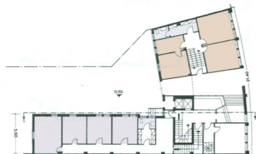
Pianta piano terra edificio nord - affaccio verso piazza S. Erasmo