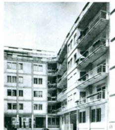
Foto d'epoca dell'intervento da piazza S. Erasmo