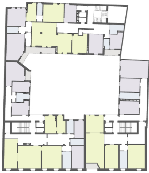
Pianta piano tipo