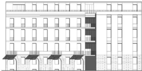
Facciata verso via Borgonuovo