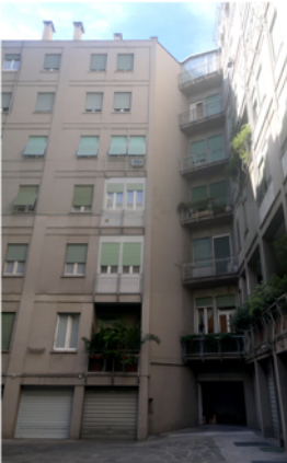
Logge sovrapposte all'angolo nord ovest della corte interna