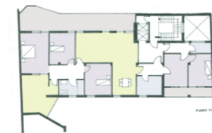
Pianta piano tipo edificio nord - doppio affaccio verso piazza S. Erasmo e verso la corte interna