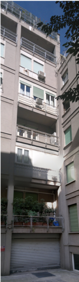
Logge sovrapposte all'angolo nord est della corte interna