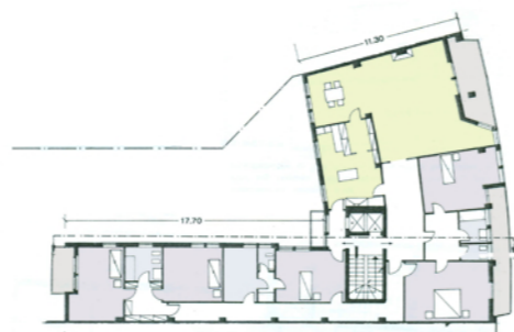
Pianta piano tipo edificio nord - affaccio verso piazza S. Erasmo