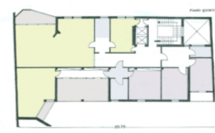
Pianta piano quinto edificio nord - doppio affaccio verso piazza S. Erasmo e verso la corte interna