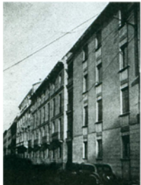
Foto d'epoca della facciata verso via Borgonuovo