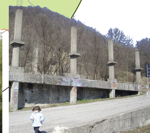
STRUTTURA MAI ULTIMATA