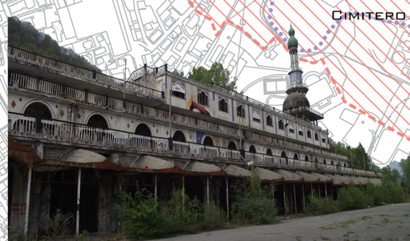
EDIFICIO CON MINARETO

L'EDIFICIO CON MINARETO È UNA COSTRUZIONE ORMAI IN ROVINA ANCH'ESSA RISALENTE AI FATTI SUCCESSIVI AL '62 COSTITUITA DA UN EDIFICIO IMPONENTE PER DIMENSIONI E DECORATO IN STILE ORIENTALE CON UN MINARETO CHE SI ELEVA SU UN LATO E CHE NE ACCENTUA LA VISIBILITÀ ANCHE DA LONTANO. FU UTILIZZATO COME PUNTO VENDITA ED ACCOLSE APPARTAMENTI PER IL SOGGIORNO DEI VISITATORI ANCHE IN VIRTÙ DI UN ECCEZIONALE VISUALE DI CUI GODE TUTTORA SU TUTTA LA VALLATA. QUALUNQUE RICERCA EFFETTUATA SU CONSONNO CONDUCE AL RITROVAMENTO DI IMMAGINI ARTISTICHE E FOTOGRAFIE DI FORTE IMPATTO EMOTIVO RELATIVE A QUESTO EDIFICIO PER QUESTO POSSIAMO AFFERMARE CHE È UN SIMBOLO DEL LUOGO RIMASTO IMPRESSO NELL'IMMAGINARIO DI TUTTI I VISITATORI.