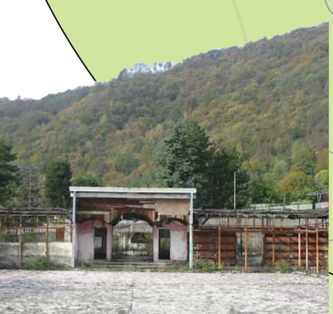
SALA DI BALLO ALL'APERTO