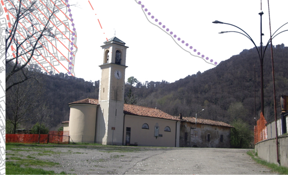
CHIESA DI SAN MAURIZIO

LA CHIESA DEDICATA A SAN MAURIZIO È DI FONDAZIONE ALTO MEDIEVALE, L'ATTUALE STRUTTURA RISALE COMUNQUE ALL'AMPLIAMENTO REALIZZATO VERSO LA FINE DEL DICOTTESIMO SECOLO AD OPERA DELLA COMUNITÀ INSEDIATA. IN ANTICO ERA UN ORATORIO DIPENDENTE DALLA PIEVE DI GARLATE POI AUTONOMA CHIESA DA SEMPRE HA RAPPRESENTATO UN ELEMENTO FONDAMENTALE PER QUESTA COMUNITÀ DEDITA ALL'AGRICOLTURA. ANCHE IL CIMITERO È DI ANTICA ORIGINE.