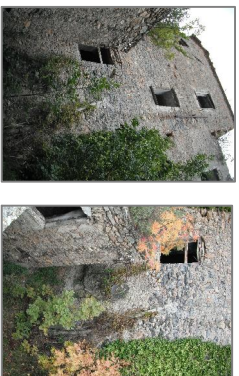
Prospetti di casa Panizza verso valle.